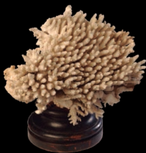
Coral del Gabinete de Franco Dávila. MNCN