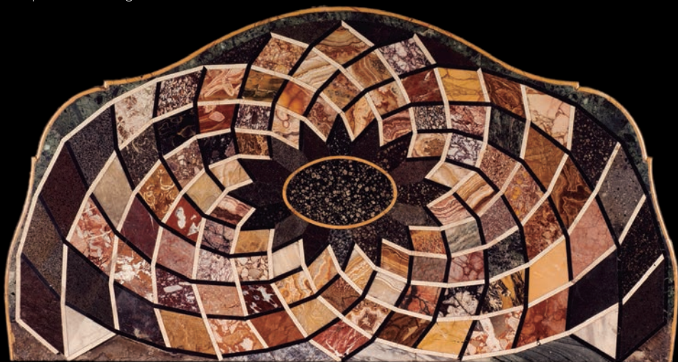
Mesa de piedras duras, siglo XVIII. MNCN