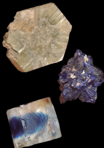
Minerales pertenecientes a la colección del Museo procedentes de diferentes localizaciones.