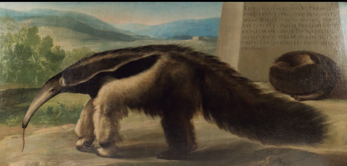
La osa hormiguera de Su Majestad, 1776. MNCN

ESTE ANIMAL SE LLAMA Oso Hormiguero POR QUE EN EL CAMBIO SE MANTIENE CON HORMI- MICAS. SE HA COPIADO AL NATURAL POR QUE QUE ESTÁ EN LA CASA DE FIERAS DEL REY EN EN JULIO DE 1726 VINO DE BUENOS AIRES CON SE CRÍAN BASTANTES DE SU ESPECIE DE SI TIRÉN LA MESA Y CRECERÁ HASTA SEIS O TE AÑOS.