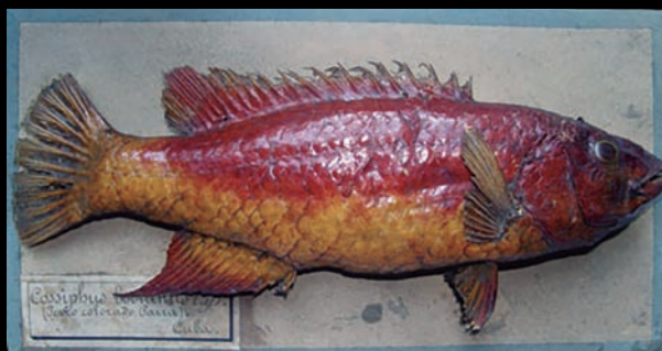
Pez naturalizado de la colección Parra, siglo XVIII. MNCN