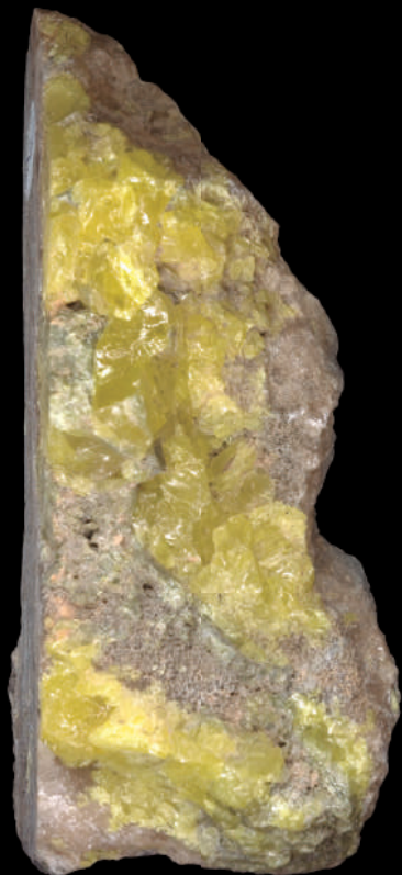
Azufre cristalizado de Conil. MNCN