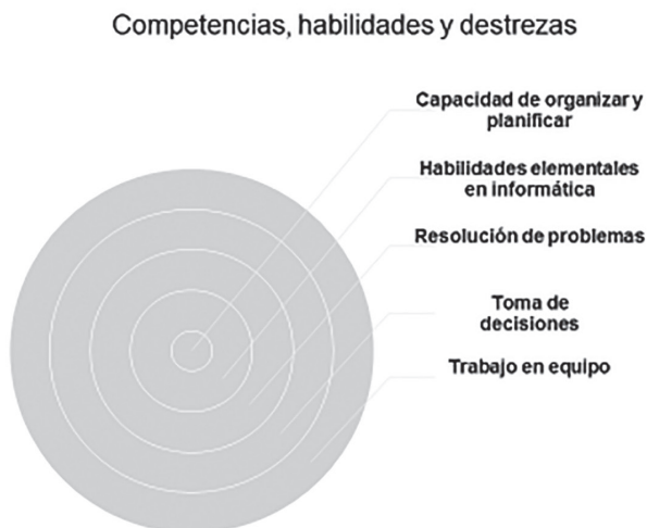
Fig. 3. Competencias, habilidades y destrezas en el EEES (elaboración propia).

por algunos como la gran alternativa moderna en el plano educativo— se está produciendo una auténtica renovación en las bases del sistema educativo y en especial en lo que respecta a la educación superior (Carrión 2010: 5-29).