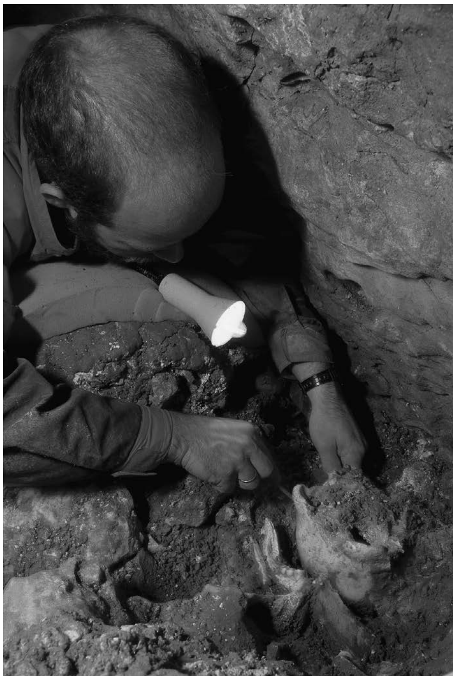
FIGURA 3. Excavando un cráneo de Homo heidelbergensis en la Sima de los Huesos, Atapuerca (España).