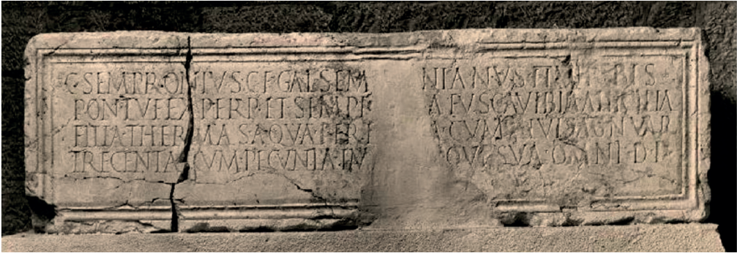
Fig. 1. Inscripción honorífica de los Sempronios.

Traducción según González, C. y Mangas, J.: «Cayo Sempronio Semproniano, hijo de Cayo, de la tribu Galeria, duoviro por dos veces, pontífice perpetuo, y Sempronía Fusca Vibia Anicila, su hija, dieron y dedicaron estas termas, abasteciéndolas de agua y dotándolas de un bosque de trescientas acnuas, todo con su dinero y a sus expensas».