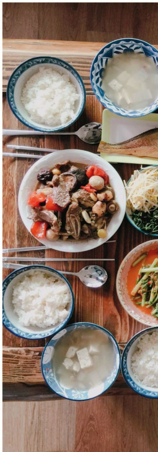
DERECHA: Mesa repleta de diversos platos coreanos.

Con esto en mente, espero que este viaje por uno de los países más fascinantes y sofisticados de Asia te inspire, al menos, a sentir y actuar con la misma pasión y, con suerte, te enseñe un par de cosas sobre cómo vivir Corea.