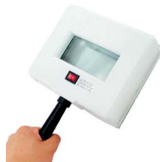
Luz de Wood

- Métodos invasivos: La biopsia cutánea (revela los cambios histopatológicos).