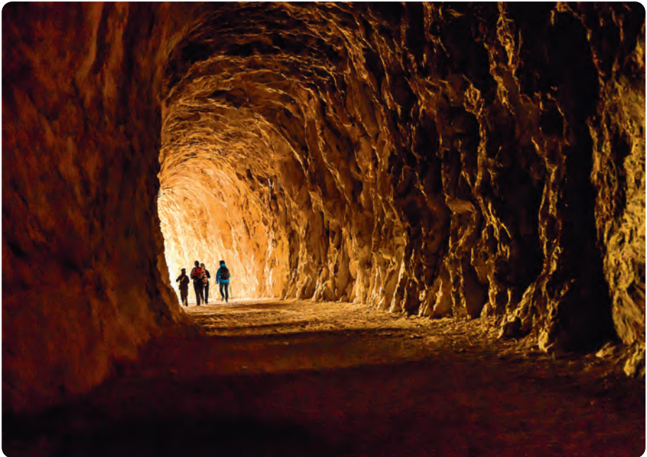
Tunelak ilunak dira; ia irteera arte ez da argirik ikusten.

Esango nuke, inoiz egon baldin bada, gorrotoa haren begiradan urtua dela aspaldi, eta haren ordez Irunberri eta Ledea arteko mendilerroaren profila itsatsita geratu dela betirako bere begi-ninietan.