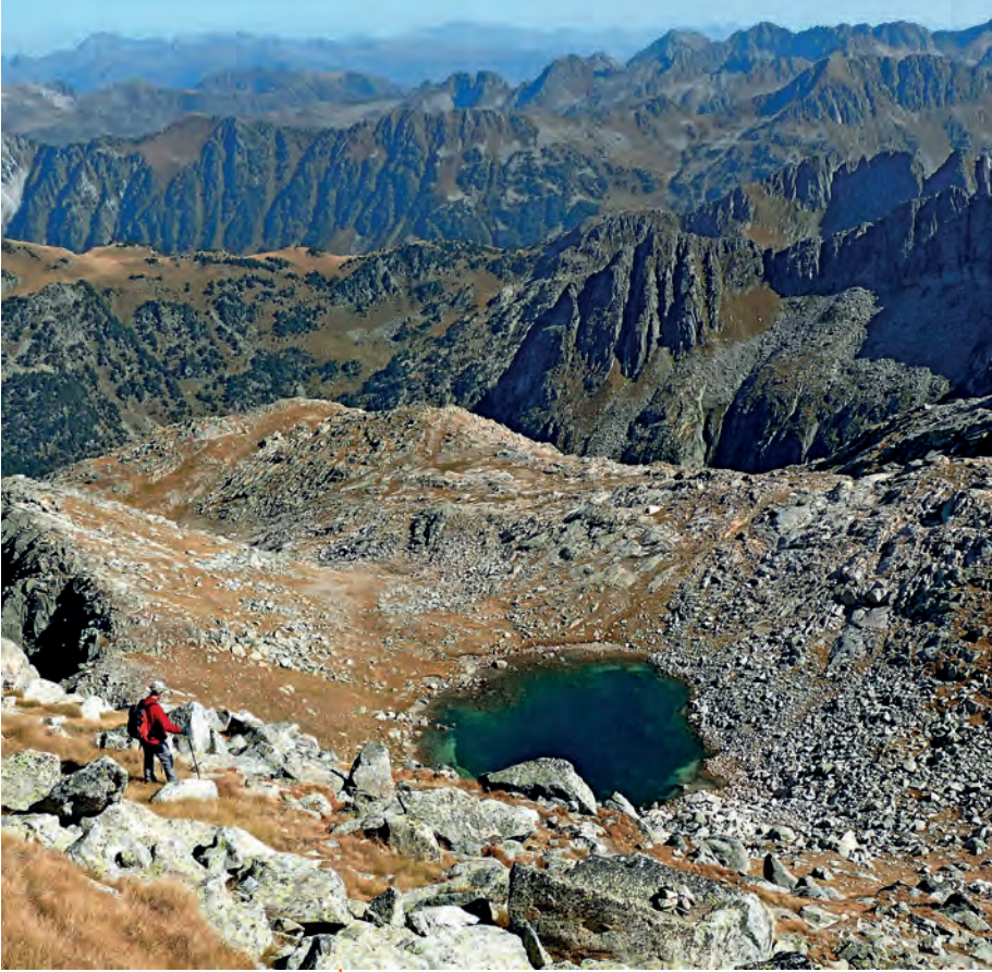
La bassa Gran del Montardo, baixant d'aquest cim.