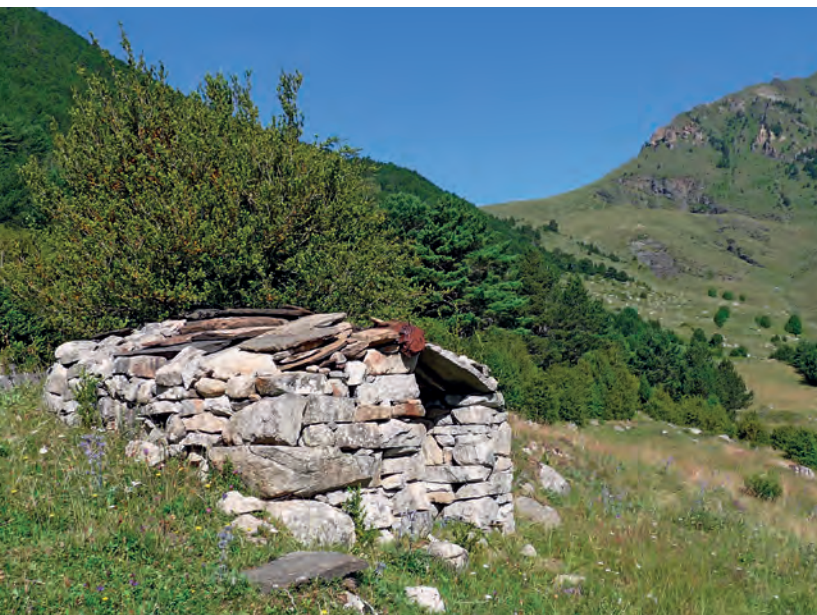
La collada de Basco des de prop del barranc Manyago.

de vegades en horitzontal, tot resseguint el límit superior del bosc. Sortim de la zona arbrada i marxem amb un mur baix de pedra flanquejant-nos a l'esquerra fins a assolir el barranc Manyago, un discret curs d'aigua que es creua fàcilment (1 h 5', 1.615 m) . Des d'aquest punt panoràmic s'albiren unes bordes conegudes popularment com Erill d'Amunt. Es tracta de velles construccions que es troben al vessant solà de la vall, arrapades a la falda de l'abrupte pendent que es despenja des de l'Aüt, extraordinari i vistós cim si es contempla des de Taüll.