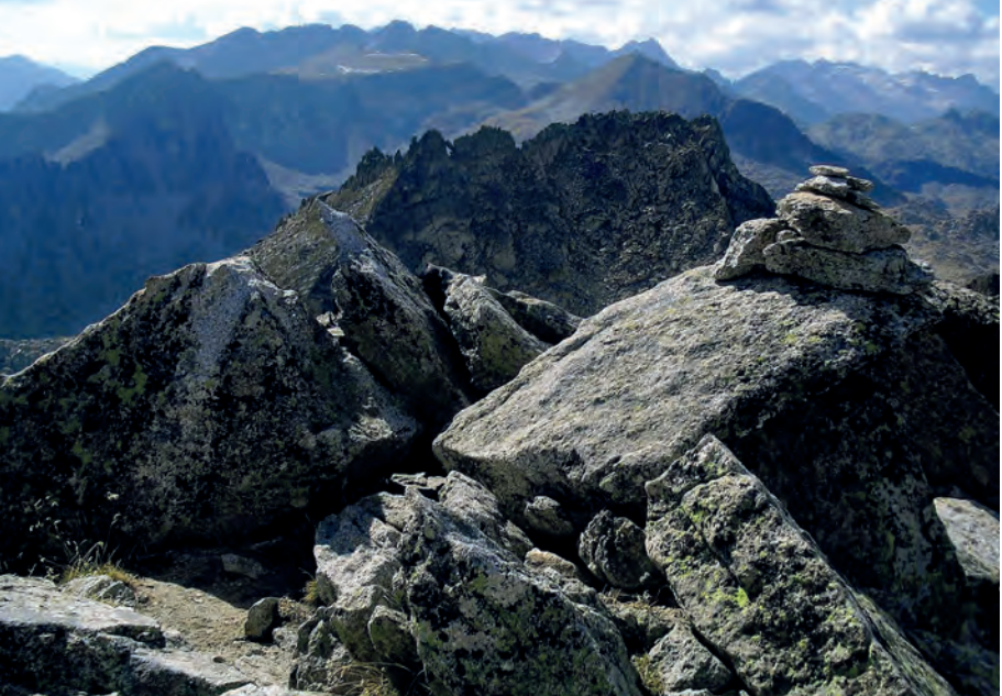
El Tuc de Saboredó des del pic d'Amitges (itinerari 7).

A l'estació superior del telefèric d'Estany Gento (tel. 973 663 001), mentre funciona, hi ha ubicat un petit centre d'informació obert de juliol a setembre. Allí podeu visitar una exposició sobre els ecosistemes aquàtics del Parc. Durant la temporada podreu disposar de servei als dos bars i restaurants existents: al peu del telefèric (Vall Fosca, 1.750 m) i a dalt, a l'estany Gento (2.200 m).