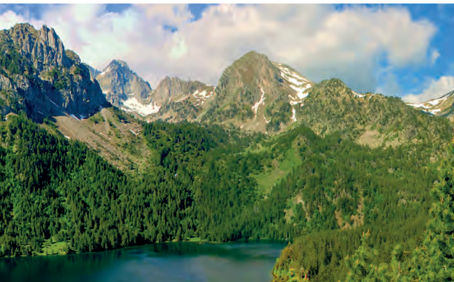
| Panoràmica des del camí d'Amitges (itinerari 10).

dictamina que els parcs nacionals han de ser gestionats per les comunitats autònomes, i l'any 2007 es publica la primera Llei de la Xarxa de Parcs Nacionals, en què s'estableixen uns criteris comuns de gestió.