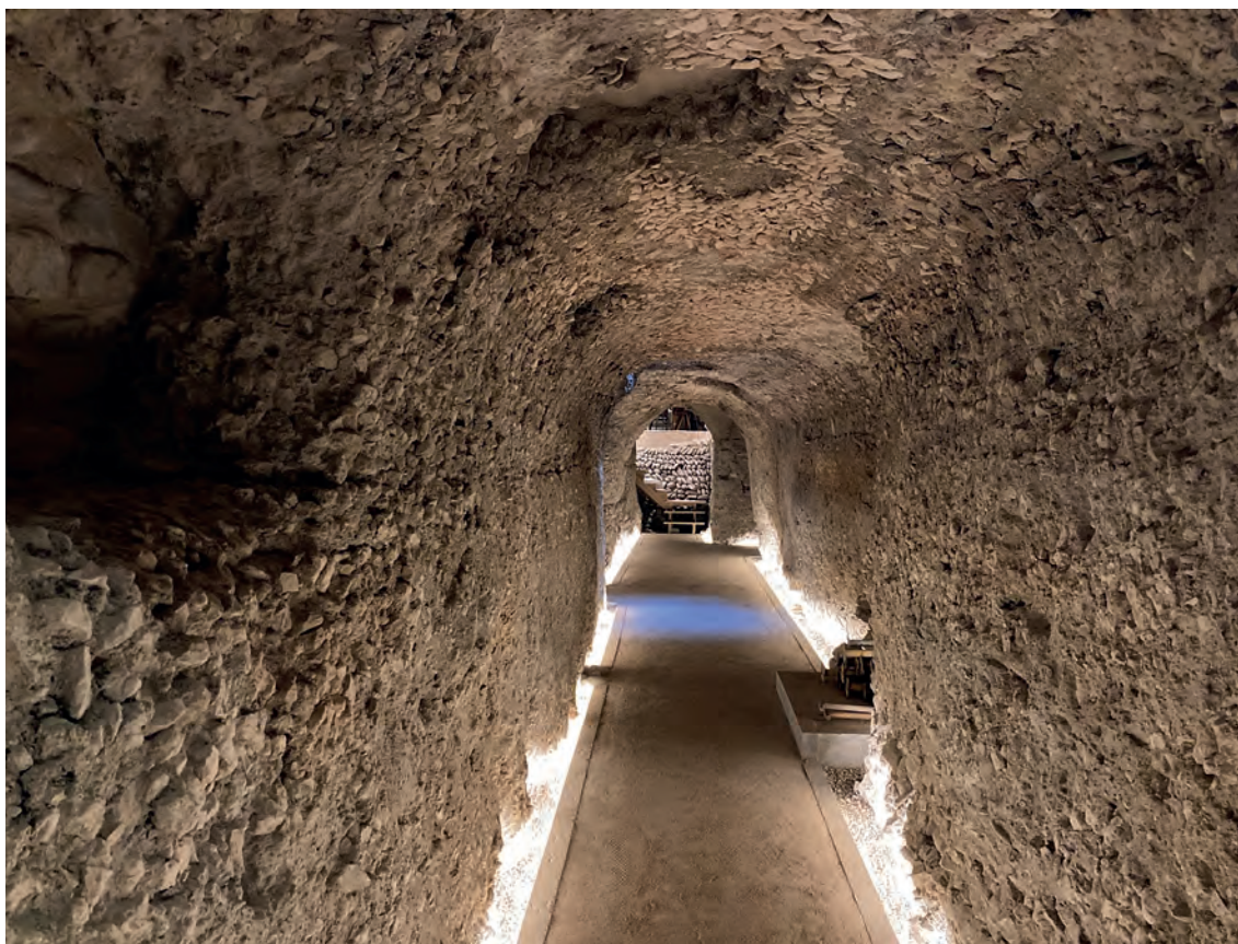
Fig. 2. Foto del Criptopórtico (Fotografía: Berendsen-Muñoz).

El espacio al norte del Albaicín siguió ocupado por una de las necrópolis de la ciudad, aunque parece que ahora abarcando un espacio más extenso y alcanzando los actuales terrenos del