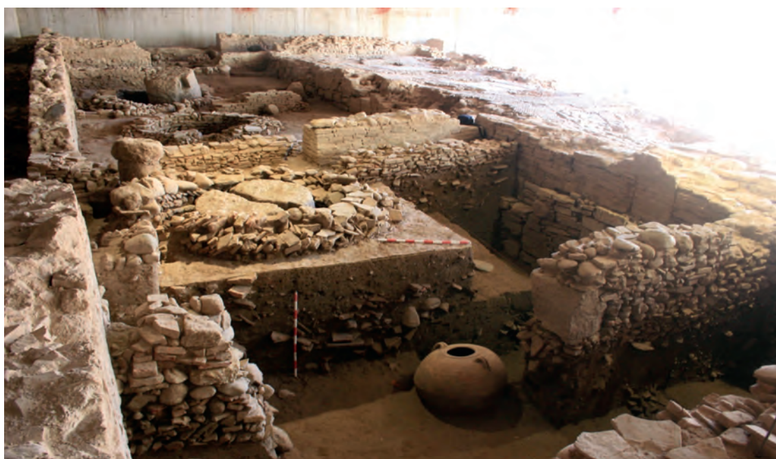
Fig. 3. Fotografía de una de las villae.

Pero la explotación económica del entorno de la ciudad romana no se limitó a su potencial agrícola, sino que también incluyó el desarrollo de una intensa minería del oro, que ha dejado sus mayores evidencias en el paisaje hoy en día visible en el Hoyo de la Campana de Lancha del Genil