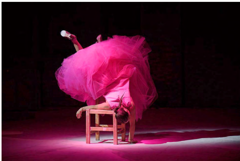
▲ Rocío Molina, Carnación (2022). La Biennale di Venezia, Biennale Danza 2022.

menco y, así, su vertiginoso zapateado —paganiniano— cada vez más amenazante y cercano al cuerpo de la violinista, obstruirá su sonido hasta aniquilarlo.