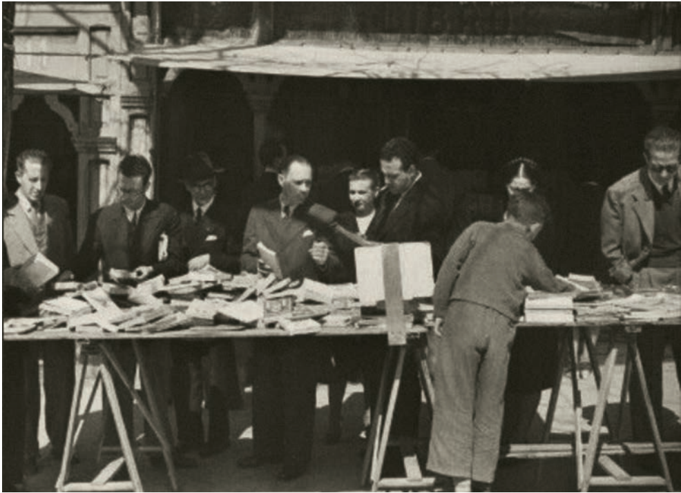
3. La Cuesta de Moyano en una imagen de los años cuarenta.

La Cuesta de Moyano es, como sabe todo el mundo, la feria de libros viejos que hay en Madrid, recostada sobre las negras tapias del Botánico. Nadie cree tampoco las historias que tienen que ver con libros viejos. Seguramente consideran que las cosas que se mezclan con librerías de viejo, almonedas, rastros, buhoneros y traperos son, a estas alturas, una forma del manierismo noventayochista, piruetas epigonales de Galdós o Baroja, algo a lo que solemos recurrir con obstinación unos cuantos escritores vocacionalmente trasnochados y menores para artistizarnos un poco, literatos mayormente de vida rutinaria y deslucida, sin gran brillo ni porvenir.