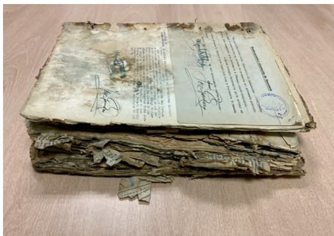
8-9. «Vitini y diez más». Expediente policial y judicial conservado en el Archivo Histórico de la Defensa de Madrid. Un amasijo de pulpa de papel y tinta de máquina de escribir que lo hace ilegible en buena parte. Más parecido a un cadáver que a un documento.

Pozo», en el que se escondían, así como la habitación donde vivían los impresores clandestinos y algunos guerrilleros. Todo se completaba, en la parte final, con los originales de una buena muestra de periódicos clandestinos y manifiestos de la delegación del comité central del Partido Comunista y de la junta suprema de Unión Nacional.