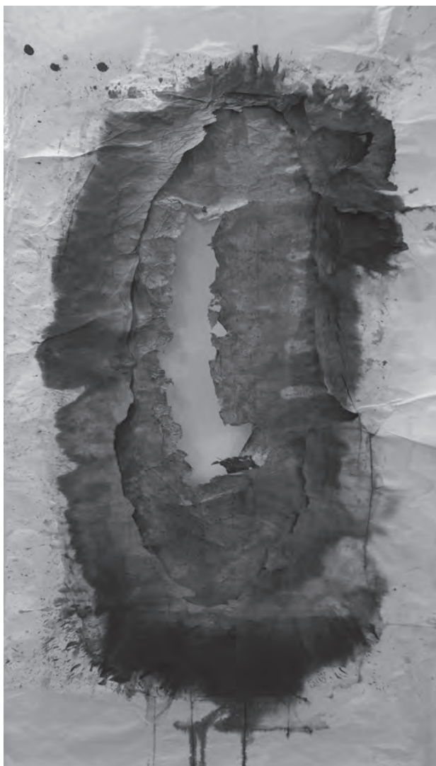
Francesca Llopis, Nosaltres & l'estat de les coses 1 2017 / tinta sobre paper / 75 x 142 cm