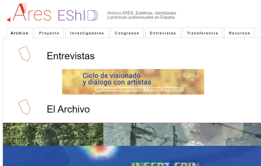
Figura 1. Vista general del sitio web del Archivo ARES

nismos, discursos poscoloniales o sobre los nuevos medios— resultan muy relevantes a la hora de dirigirnos a estas manifestaciones artísticas. Dentro de las mencionadas especialidades, el arte audiovisual, en un contexto globalizado, está muy vinculado al desarrollo de los nuevos medios de comunicación e información desde mediados del siglo pasado y, en mayor medida, en estas primeras dos décadas del siglo XXI (Borgdorff 2012). Dicho escenario se potencia con el empleo de internet como medio de difusión de las obras en vídeo, tal y como proponemos en el proyecto con la creación de un archivo en línea y en abierto. De este modo, es factible diversificar y ampliar las posibilidades de los discursos y las narraciones, visibilizando la diversidad, la identidad nómada, la deconstrucción de los modelos de representación y la experimentación con nuevos imaginarios, multiplicando su recepción (Martín Prada 2018).