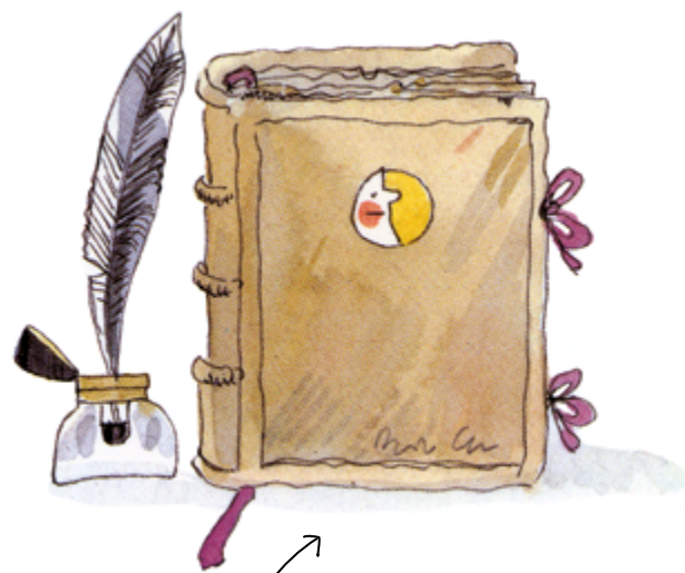
MANUSCRIT DE LA BRUIXA AVORRIDA