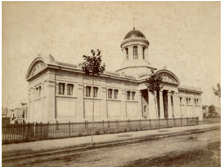
↗ Imatge de la biblioteca museu acabada de construir.