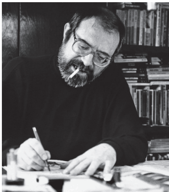
Jaume Perich treballant al seu estudi a principis dels anys 90.

El llegat de Perich és immens. Bona part dels dibuixants satírics de la premsa actual a casa nostra en som deutors d'una manera o altra. I per al gran públic, Perich és encara un referent prou consistent per tornar-hi a trobar aixopluc davant les incerteses i atzagaiades de l'actualitat política. Perich ja és patrimoni de tots, i per això, amb molt bon criteri, la seva família va decidir dipositar bona part de la seva deïxa a l'Arxiu Històric de la Ciutat de Barcelona, que fins i tot va batejar la sala de consulta de la secció de Gràfics de l'antiga Casa de l'Ardiaca amb el nom de Sala Jaume Perich. Aquest llegat inclou milers de dibuixos originals, però també tota mena de documents, on es troben des de fulls amb esbossos i llibretes