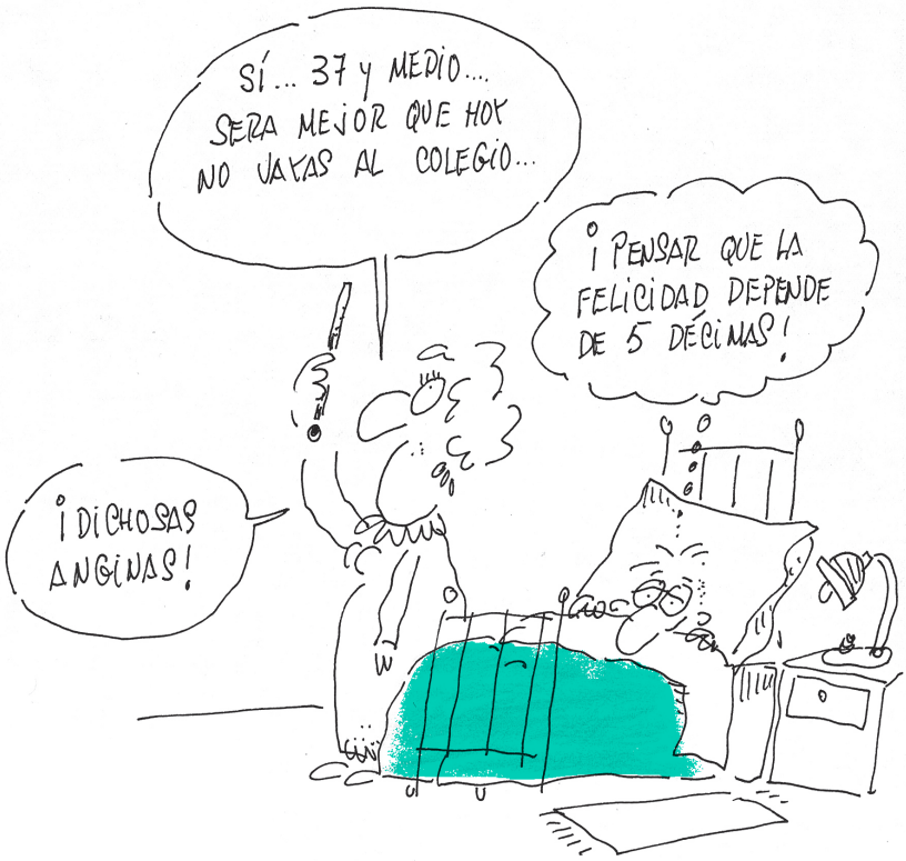
(Sí, sí... décimas, décimas)