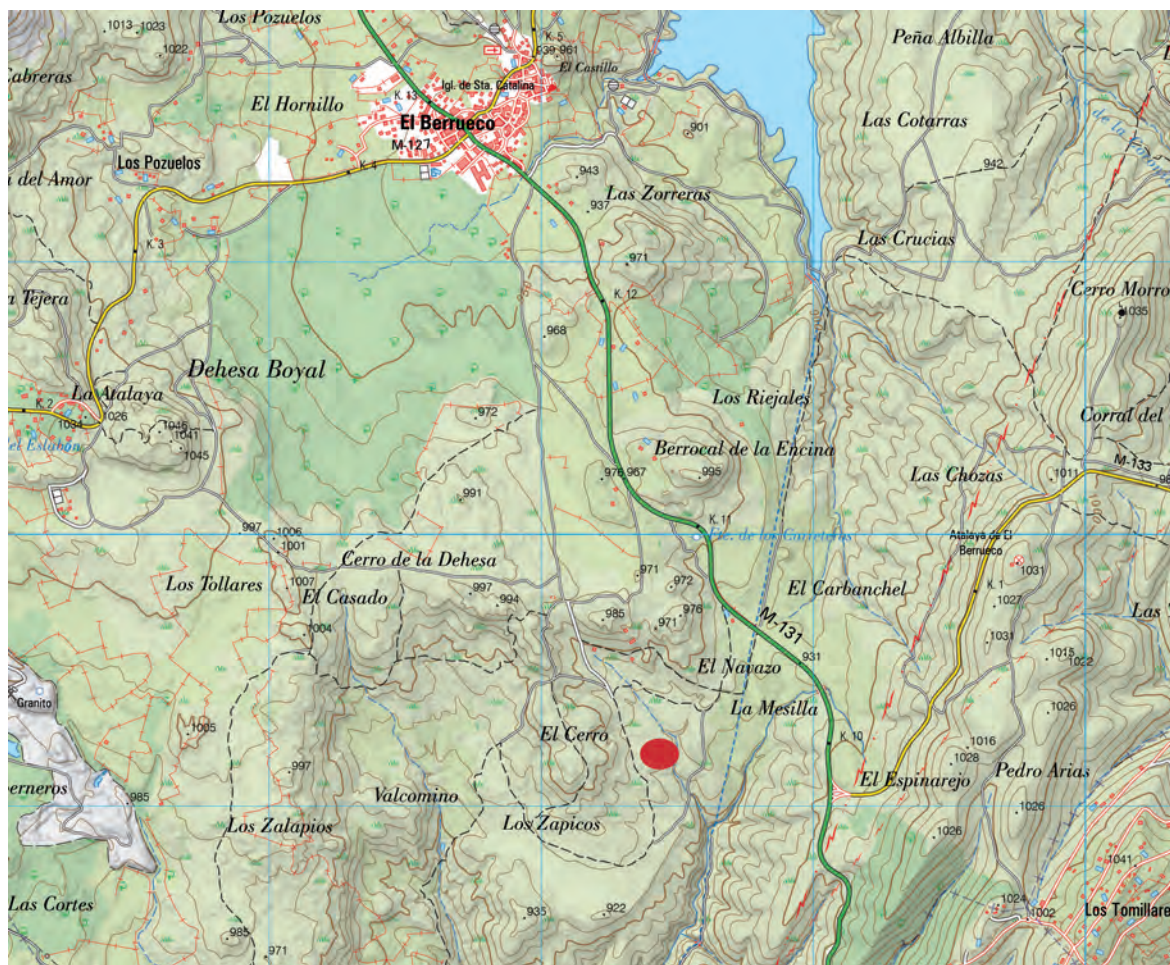
Figura 1. Ubicación de la iglesia de Valcamino en la sierra norte madrileña (I.G.N.).

Analizamos los restos arquitectónicos del templo excavado, enterramientos y elementos del antiguo rito