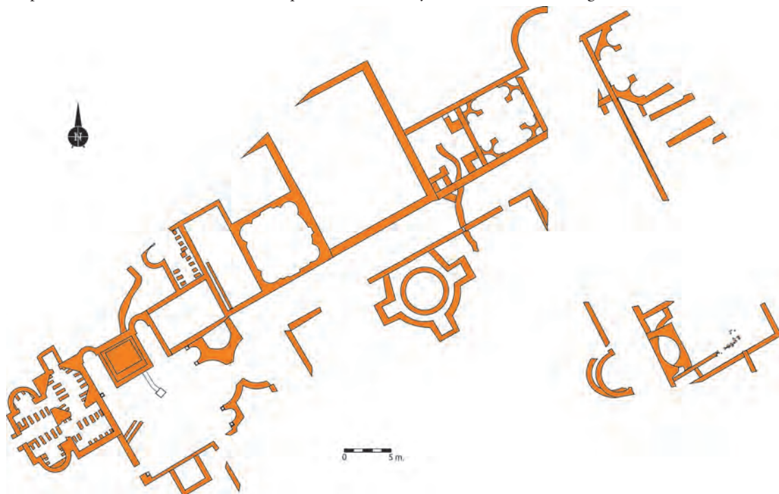
Figura 1. Planimetría de las estructuras arquitectónicas pertenecientes a la villa bajoimperial. Segunda fase (fines del s. III/inicios del s. IV- fines del s. V/inicios del s. VI). Autora: A. M a . López Pérez, Proyecto El Saucedo.

pertenecientes a este período inicial, sí se han hallado monedas, vidrios y terracotas de cronología altoimperial, así como abundantes piezas cerámicas de las más diversas producciones altoimperiales: TSI, TSG, TSH de procedencia norteña y del taller ubicado en los alrededores de Caesarobriga (Donate et alii e. p.), TSHB, cerámica de paredes finas emeritenses y cerámica pintada romana de tradición indígena (Sequera et alii 2018), todo ello hallado en contextos de basureros distribuidos por diferentes zonas del yacimiento, materiales que en conjunto se fechan entre la segunda mitad del siglo I y el último cuarto del siglo II d. C.