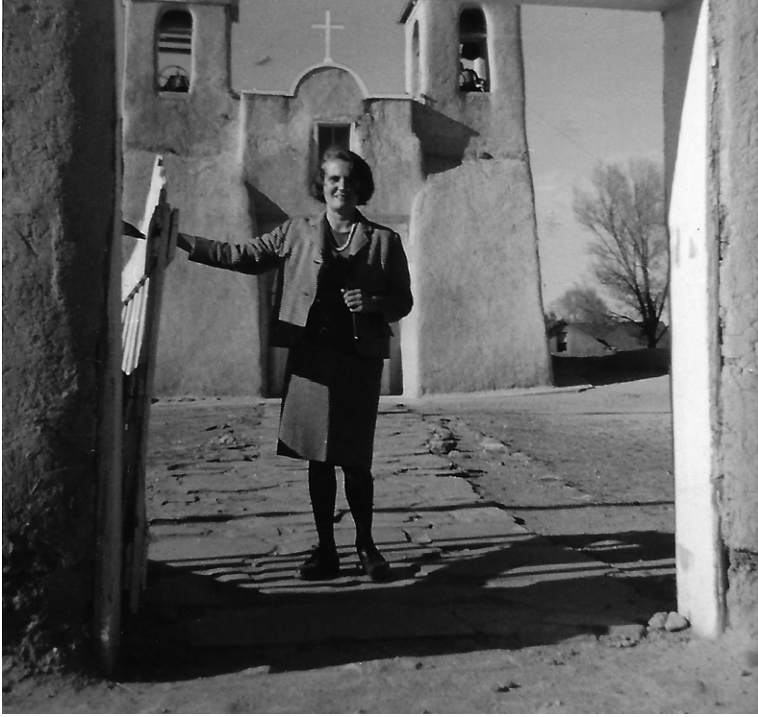
Carmen Laforet delante de una pequeña iglesia de Santa Fe.

Carmen Laforet, fiel a sus principios de novelista «observadora», recorre los Estados Unidos sin ánimo de juzgar ni de explicar. Procura ceñirse a consignar lo que ve, lo que oye, lo que a ella misma le ocurre, con su peculiar sentido del humor. El resultado es una crónica de gran plasticidad y de una inocuidad solo aparente: las contradicciones, las grandezas y las miserias no necesitan ser aisladas ni subrayadas, se manifiestan por sí mismas.