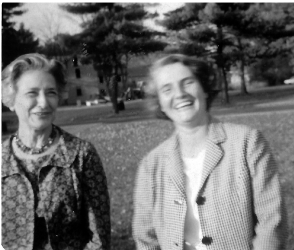
Carmen Laforet en Wellesley College.

pegaba. En Estados Unidos, la «contracultura» hacía acto de presencia y los conflictos raciales exigían soluciones. La crisis de los misiles, el asesinato de Kennedy, habían puesto en jaque muchas certezas. Baste citar los disturbios de Watts, aquel mismo año, para entender qué estado de espíritu encontró la autora a su llegada a Nueva York, casi al mismo tiempo que Pablo VI, que iba a pronunciar su célebre discurso, en defensa de la paz, ante las Naciones Unidas. A su regreso a España, un periodista le pregunta si la democracia «se nota en la cara». «No —contesta ella— la democracia se nota en que le preguntas a alguien y te contestan tan tranquilos sobre todo lo divino y lo humano, sin importarles nada de nadie, sin temor, con la mayor despreocupación, y te dan su nombre y todo.» (Diario Ya , 28 de mayo de 1966)