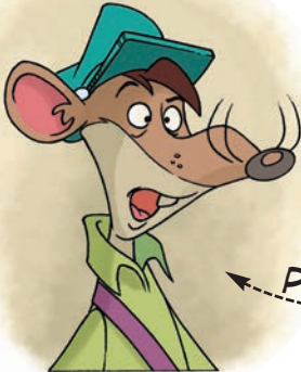
← PORFIRI PANXARRUT

Porfiri havia vingut fins a Ratalona per entregar-me un paquet groc amb un llaç rosa.