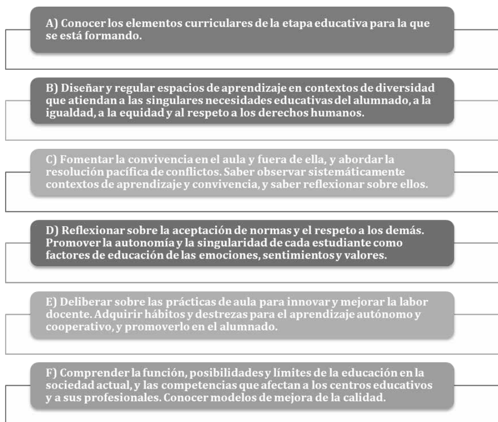
Figura 1. Competencias básicas

Y esta es la estructura de los saberes básicos de la materia: