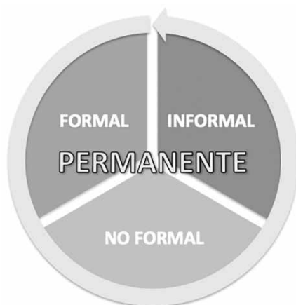
Figura 2. Tipos de educación

¿Cuáles son las particularidades que presentan la educación formal, informal o no formal?