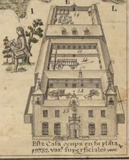
Esta Casa ocupa en su planta 19332 var. superficiales.