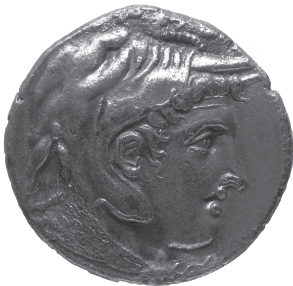
Ptolomeo I Sóter

También fue uno de los grandes supervivientes. En los veinte años de caos que siguieron a la muerte de Alejandro, cuando muchos hombres más hábiles acabaron muertos, Ptolomeo jugó bien sus cartas y ganó. De todos los sucesores que se repartieron el breve y enorme imperio de Alejandro, creó la dinastía más duradera, el reino más estable. Decidió instalarse en Egipto y nunca arriesgó su reino buscando un imperio más extenso. Después de él, se sucedieron catorce gobernantes ptolemaicos hasta que Cleopatra lo perdió todo en la batalla de Accio doscientos cincuenta años después. Así pues, estamos ante el primer rey de la última dinastía egipcia, la dinastía lágida (por el nombre del padre de Ptolomeo, Lagos); basileos