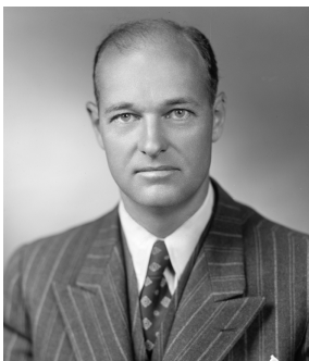
George F. Kennan en 1947.

Según iba creciendo la tensión con Moscú, la Administración estadounidense permitió la difusión del texto, bajo el título «Las fuentes del comportamiento soviético», en la revista Foreign Affairs en julio de 1947, con el pseudónimo de «X». Su publicación provocó uno de los primeros debates intensos sobre la política exterior estadounidense en el nuevo contexto de la Guerra Fría, pero es evidente que sus planteamientos se convirtieron en doctrina oficial de Estados Unidos. 📄