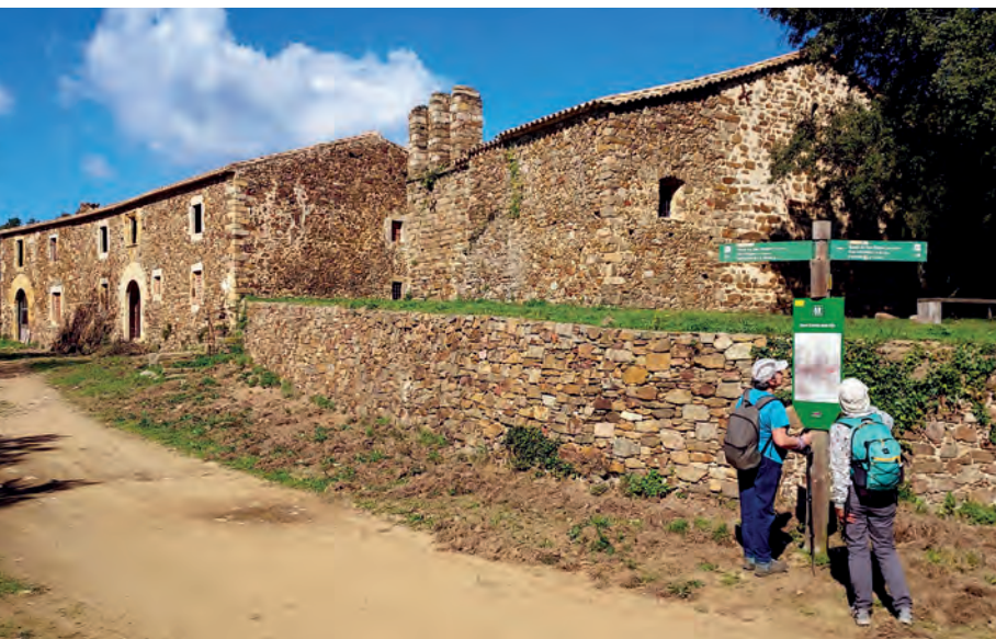
Sant Cebrià dels Alls (itinerari 15).

rents de Cavorca i del Folc, entre molts d'altres), que baixen encaixonats per les estretes valls del sector nord, més agrest, o que llisquen tranquil·les per les seues ondulacions granítiques del sud i per les planes situades als peus del massís. La majoria d'aquests rierols desguassen a les conques de l'Onyar i del Daró, les més extenses del massís. (Informació extreta de: www.gavarres.com .)