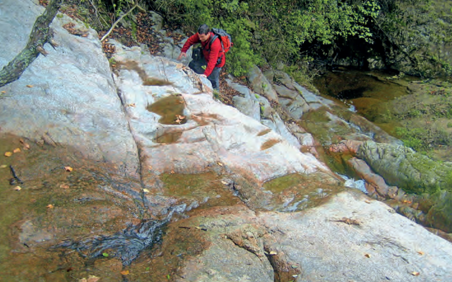
Remuntant el ressalt de la Murtra.

facilita superar els obstacles naturals breus que presenta el recorregut. Anem remuntant i, més amunt, una passarel·la ens fa arribar al ressalt de la Murtra, amb bassal inclòs. Superat aquest tram, més endavant trobem un pontet suspès i les Escales del Diable. Es tracta d'un tram d'ascens esglaonat amb fustes, equipat amb un passamà, que ens ajuden a franquejar el desnivell considerable d'un cingle rocós del que en diuen el Salt del Llop, amb una caiguda d'aigua d'aproximadament 55 metres, el més alt de les Gavarres (1 h 37', 132 m) .