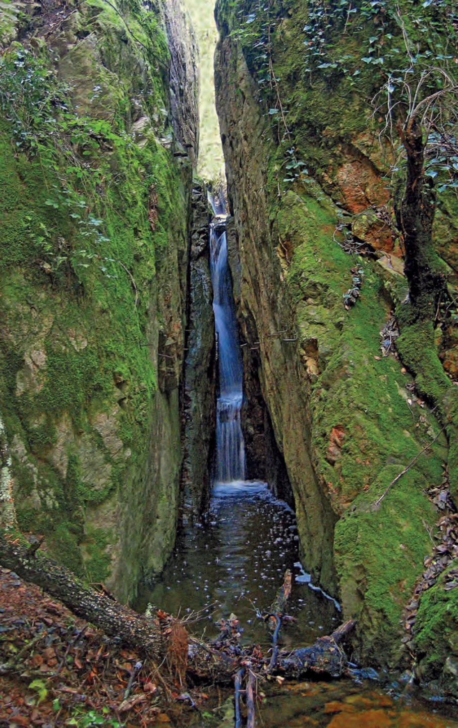
Pou de les Goges (itinerari 1).