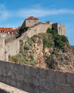
Les muralles de Dubrovnik