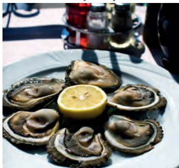
Mali Ston és famosa per les seves ostres

A part de tenir dues cultures, Croàcia té dos climes diferents. Al llarg de la costa el clima és mediterrani, amb estius secs i calorosos, encara que el vent bura que ve de les muntanyes refresqui les tardes. Durant l'hivern plou molt, però els Alps Dinàrics protegeixen la costa del clima fred. A la costa que va de Dubrovnik a Split sovint hi ha un o dos graus més que al nord, des de la costa dalmàtica fins a Ístria. L'illa de Hvar és el lloc més assolellat de Croàcia.