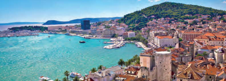
Split, una de les ciutats adriàtiques més vives i atractives per als turistes

tes: té 1.778 km i va des d'Ístria fins a Dubrovnik, amb més de 1.185 illes i illots que són adients per fer esport i relaxar-se.