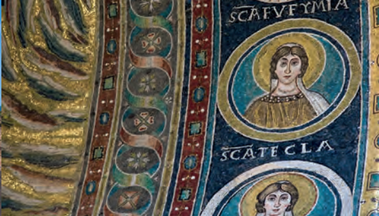
El mosaic de la basílica de Sant Eufrasi, Poreč

A l'interior, el clima és continental. A vegades la neu cobreix Zagreb i els boscs, i les baixes temperatures i glaçades són habituals de desembre a finals de febrer.