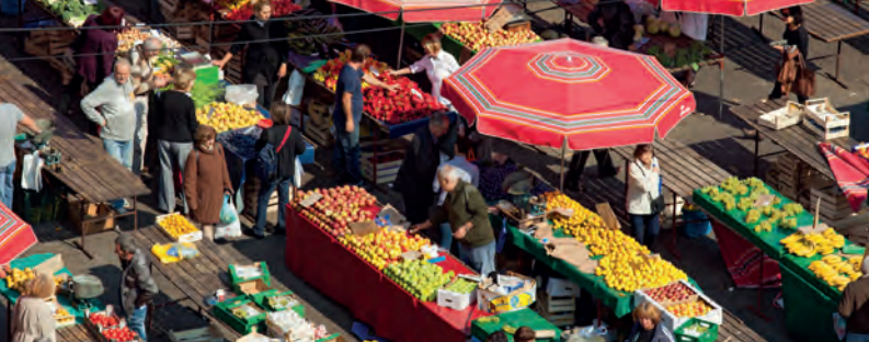
El mercat Dolac a Zagreb, amb els distintius para-sols vermells

A l'hivern fa massa fred per nedar al mar, però Dubrovnik és igual d'encantador, i el podeu compartir amb els habitants en comptes dels turistes. Durant aquesta època de l'any Zagreb està en auge, i podeu esquiar a fora del poble. La primavera és la millor època per visitar els llacs de Plitvice i el parc nacional de Krka perquè les cascades van plenes de l'aigua de la neu de l'hivern.