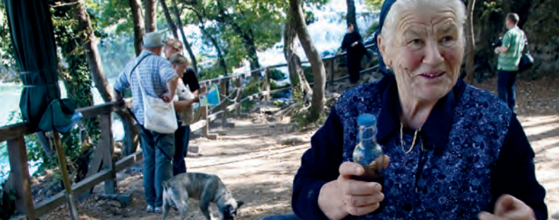
Venent rakija al parc nacional de Krk

vitats locals són al voltant de Pasqua i estan connectades amb els dies dels sants locals i de fets històrics. Una de