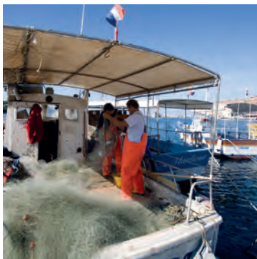
Pescadors al port de Rovinj

Als croats els agrada mostrar l'herència cultural tan rica que tenen. No és gens difícil per a les comunitats convèncer els ciutadans que participin en recreacions històriques o en els balls nacionals, per mantenir vives les tradicions dels seus avantpassats, que són diferents entre les regions i fins i tot entre les illes. Moltes de les festi-