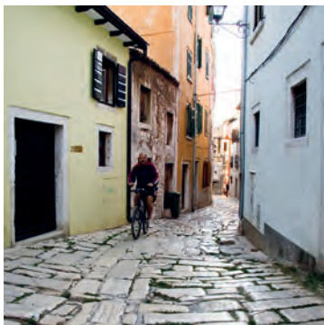
Un carrer estret i empedrat de Rovinj

Els habitants de la segona ciutat de Croàcia tenen raons per estar ben orgullosos: del seu equip de futbol, Hadjuk Split; de bons tennistes com Goran Ivanišević i Mario Ančić, i de l'equilibri de la ciutat entre modernitat i antiguitat.