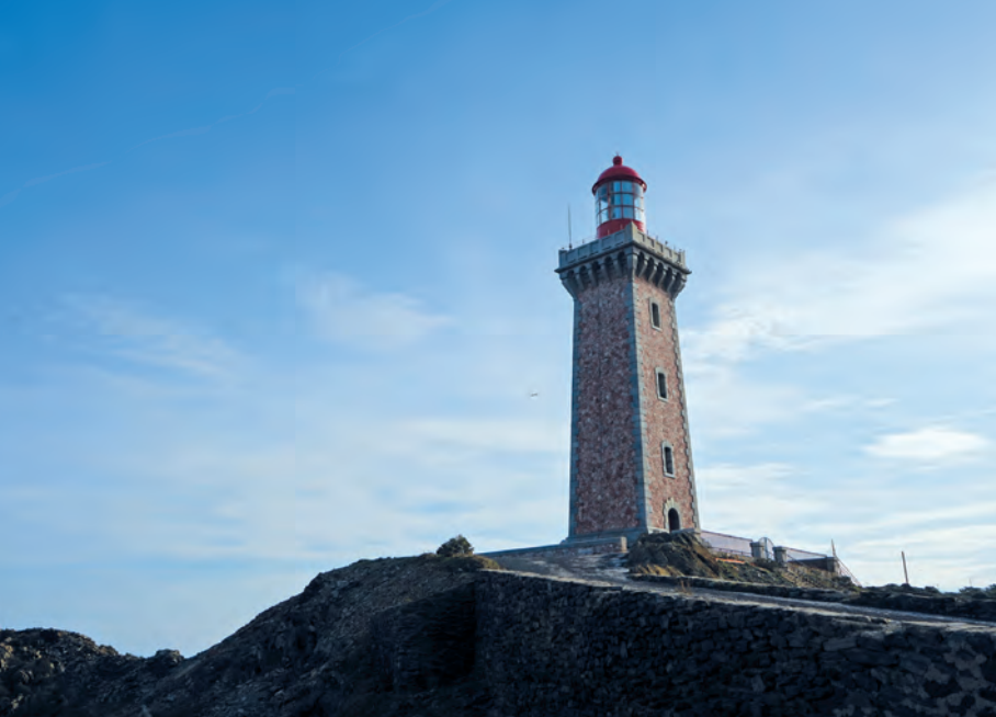
El far del Cap de Biarra (o de Cap Béar)