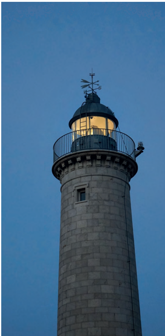
El far de Sant Cristòfol, a Vilanova i la Geltrú

Sigui com sigui els fars són part indestriable del patrimoni històric i arquitectònic. I ho són també a parts iguals del patrimoni natural. Hem integrat els fars com a elements vius dels nostres paisatges costaners. El far del Fangar és part de la inacabable llengua de sorra de la platja de la Marquesa, igual que el far de Cala Nans culmina el paisatge abrupte sobre la petita cala de Sa Sabolla o que el far de les Illes Medes posa la cirereta amb la seva cúpula vermella sobre la roca, al capdamunt de la Meda Gran. Els fars són de la mar i de la terra. Guardians i guies de navegants i, alhora, icones universals de recolliment i llibertat. Avui l'horitzó és fosc i ple d'incerteses. Necessitem, més que mai, que els fars no deixin de picar-nos l'ullet.