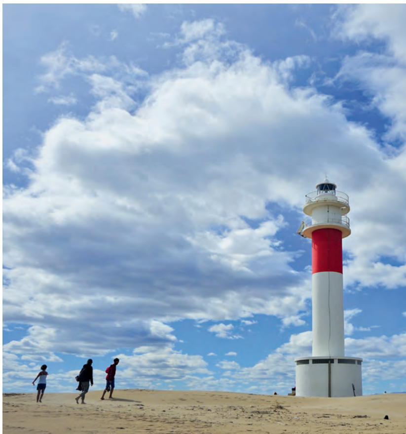
La platja de la Marquesa i el far del Fangar

de la calor sobre l'aire, el qual altera la refracció de la llum i crea la il·lusió.