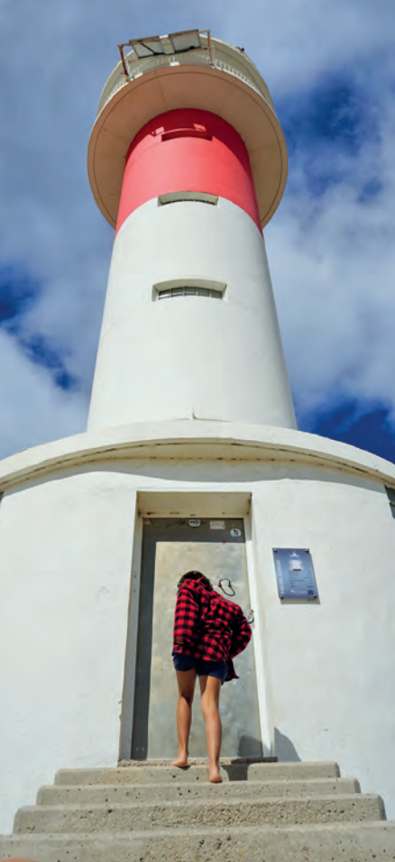
Escalles i porta d'entrada del far