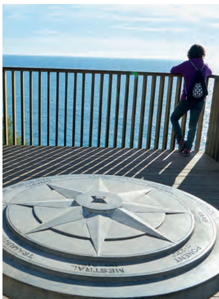
El mirador i la rosa dels vents al cap de Salou

carro a través de camins que no tenien gaire bones condicions. El 1934 es va construir la carretera fins al far perquè els enginyers que el visitaven un parell de vegades al mes poguessin accedir-hi més còmodament. El far va apagar-se només durant la Guerra Civil, tal com va passar amb altres fars del litoral. Avui dia és un dels pocs fars que encara acull el torrer que se'n fa càrrec. La millor manera de veure l'edifici i la torre és envoltant-los a peu pel camí de ronda que ressegueix el cap de Salou. Fa poc que s'hi han habilitat algunes passeres, pasarel·les, miradors i plafons amb informació sobre el far, el paisatge que s'albira i la fauna i la flora més característica de l'entorn.