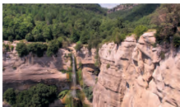
Salt de Sallent

Des de Rupit, un seguit de rutes ens duen a llocs extraordinaris, com el salt de Sallent , en què la riera de Rupit es precipita al buit des de gairebé 100 metres d'altura, imatge visible des d'un mirador de vertigen. És una excursió fàcil, d'uns 40 minuts d'anada, que es pot completar, si no volem tornar pel mateix lloc, travessant la riera i, per un ampli camí, anar a buscar la pista forestal que puja des del pantà de Sau fins a Rupit. Per aquest camí, passarem pel costat de l'església romànica de Sant Joan de Fàbregues . En una mica més d'una hora haurem arribat a Rupit; l'itinerari és un xic més llarg que si tornéssim pel mateix lloc, però és millor camí i així canviem de panorama.