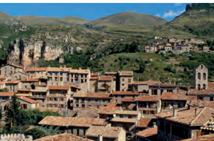
Castellar de n'Hug

És imprescindible per cuidar el ramat i, des de l'any 1962, el darrer diumenge d'agost se celebra un concurs en el qual participen pastors d'arreu de l'Estat espanyol i on es mostren les habilitats d'aquesta classe d'animals. L'entrada de la població la presideix un monument al pastor i al seu gos, mentre a l'interior podem visitar el Museu del Pastor , on coneixerem tot el que fa referència a aquesta feina.