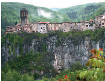
Castellfollit de la Roca

Sens dubte, ens trobem davant d'un dels pobles amb més encant del Principat, que a més disposa d'un entorn privilegiat, amb una de les mostres del romànic més interessants d'aquestes contrades: l'ermita de Sant Feliu de Beuda, Sant Pere de Lligordà i el Sant Sepulcre de Palera són només alguns exemples. També, molt a prop, es troba un altre poble molt singular. Castellfollit de la Roca s'estira al capdamunt d'una cinglera per damunt del Fluvià; és una imatge propícia per a la càmera fotogràfica.