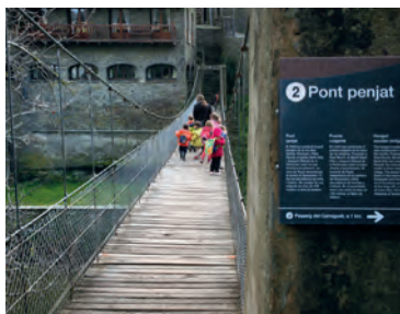
Pont penjant sobre la riera de Rupit

Per altra banda, fondes i botigues de productes tradicionals completen l'àmplia oferta d'un poble que, en determinades èpoques, està de gom a gom. Rupit va ser declarat Conjunt Historicartístic tant per la seva singular orografia com per la conservació dels carrers i les cases dels segles XVI i XVII.