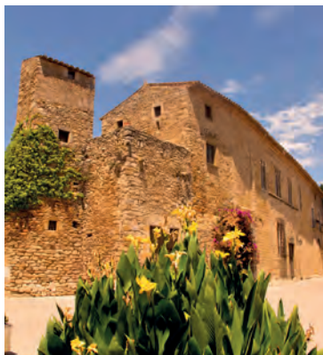
Castell-palau de Peratallada

segle XVIII; al seu voltant hi ha diverses tombes medievals excavades a terra. A Palau-sator sobresurt una torre de 20 metres d'altura, resta de l'antic castell que durant els segles X i XI presidia la vila; al terme municipal hi ha l'església preromànica de Sant Julià de Boada. A Cruïlles destaca la torre cilíndrica de l'antic castell, que rivalitza amb el campanar romànic de l'església de Santa Eulàlia. Finalment, Monells presenta una bonica plaça porticada de la qual parteixen els diferents carrers que formen la vila. A prop de la plaça s'alça l'antic palau-fortalesa, ara convertit en hotel.