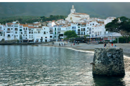
Cadaqués. Platja Gran

A poc menys d'un quilòmetre de la població, Portlligat fou el lloc que escollí Dalí per fixar la seva residència. L'illa de Portlligat tanca la bonica cala i la converteix en un lloc arcerat. Un parell d'hoteles, quatre barraques de pescadors i la casa de Dalí eren les úniques construccions d'aquest paisatge tants cops pintat pel Diví . La casa, convertida en museu, forma part d'aquest univers dalinià. L'artista va anar comprant petites casetes i les va unir; per això no hi ha cap espai grandiloqüent i les visites es fan en grups reduïts. Decoració barroca i objectes inversemblants permeten esbrinar l'extravagància del pintor i la seva musa Gala.