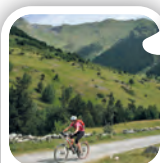
Bagergue (Val d'Aran)

Al litoral no ens podem descuidar del Port de la Selva que, vist des del monestir de Sant Pere de Rodes, se'ns ofereix com una munió de cases blanques que voregen la badia; Calella de Palafrugell , amb les típiques voltes arran de la platja de Port Bo i la seva cantada d'havaneres perfumada pel cremat de rom; o, més al sud, a tocar de les Terres de l'Ebre, l'Ametlla de Mar , de blanca façana porxada a sobre del port pesquer.