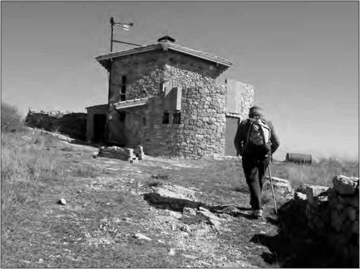
Refugi dels Cogullons

1 h 45'. Pista i pal indicador. Anem cap a la dreta.