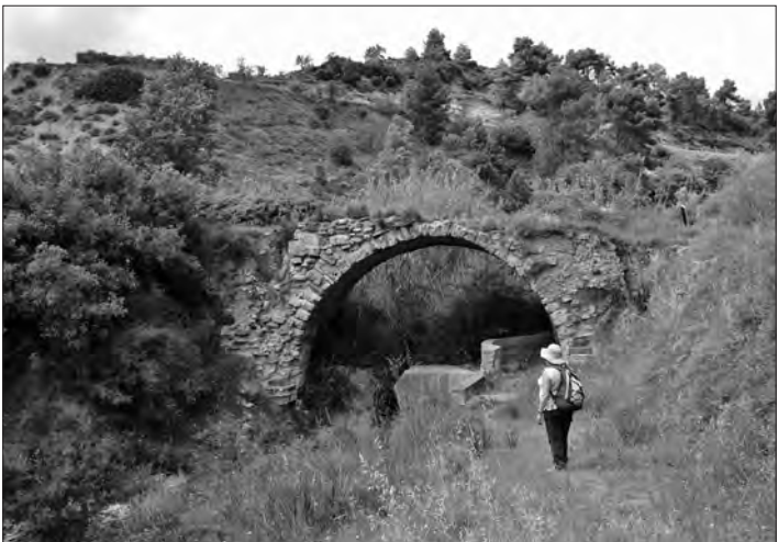
El pont medieval que creua el riu Anguera