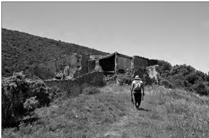
Arribada a Rocamora

0 h. Viladeperdius (650 m). Al sortir del poble, anem seguint uns quants metres per la carretera i de seguida continuem per un camí que surt cap a la dreta. Pal indicador en direcció a Sant Magí de Brufaganya.