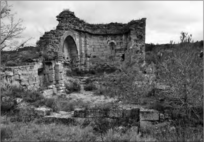
Sant Pere d'Anguera

A causa de la pesta de 1348 i de la guerra de la Generalitat contra Joan II quedà tot gairebé enrunat. El 1600 apareix com a possessió de l'abat de Santes Creus i el 1630 s'esmenta que la castlania va a càrrec de la família Biure.