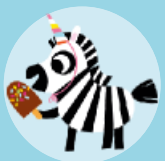
Una zebra disfressada d'unicorn