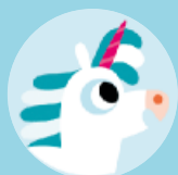
Un unicorn amb la banya rosa