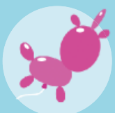
Un globus unicorn