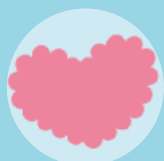
Un núvol en forma de cor