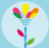
Una flor màgica multicolor