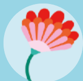
Una flor gegant