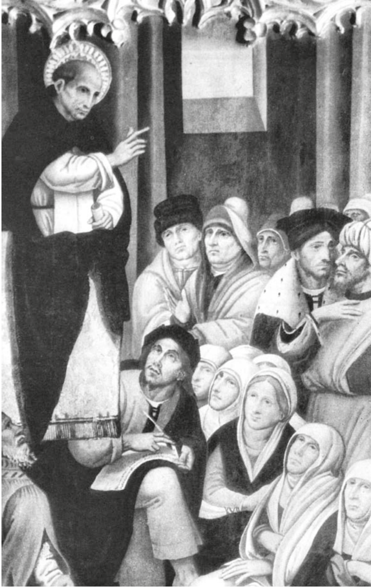
San Vicente Ferrer. Detalle del retablo del siglo XVI conservado en Santo Domingo de Valencia. San Vicente influyó en gran manera en el destino de Alonso de Borja. Él fue quien convenció a la familia para dedicarle a la religión, quien le introdujo en la corte del rey de Aragón, quien le presentó al papa Luna y quien, según la leyenda, predijo que sería papa y que le canonizaría.