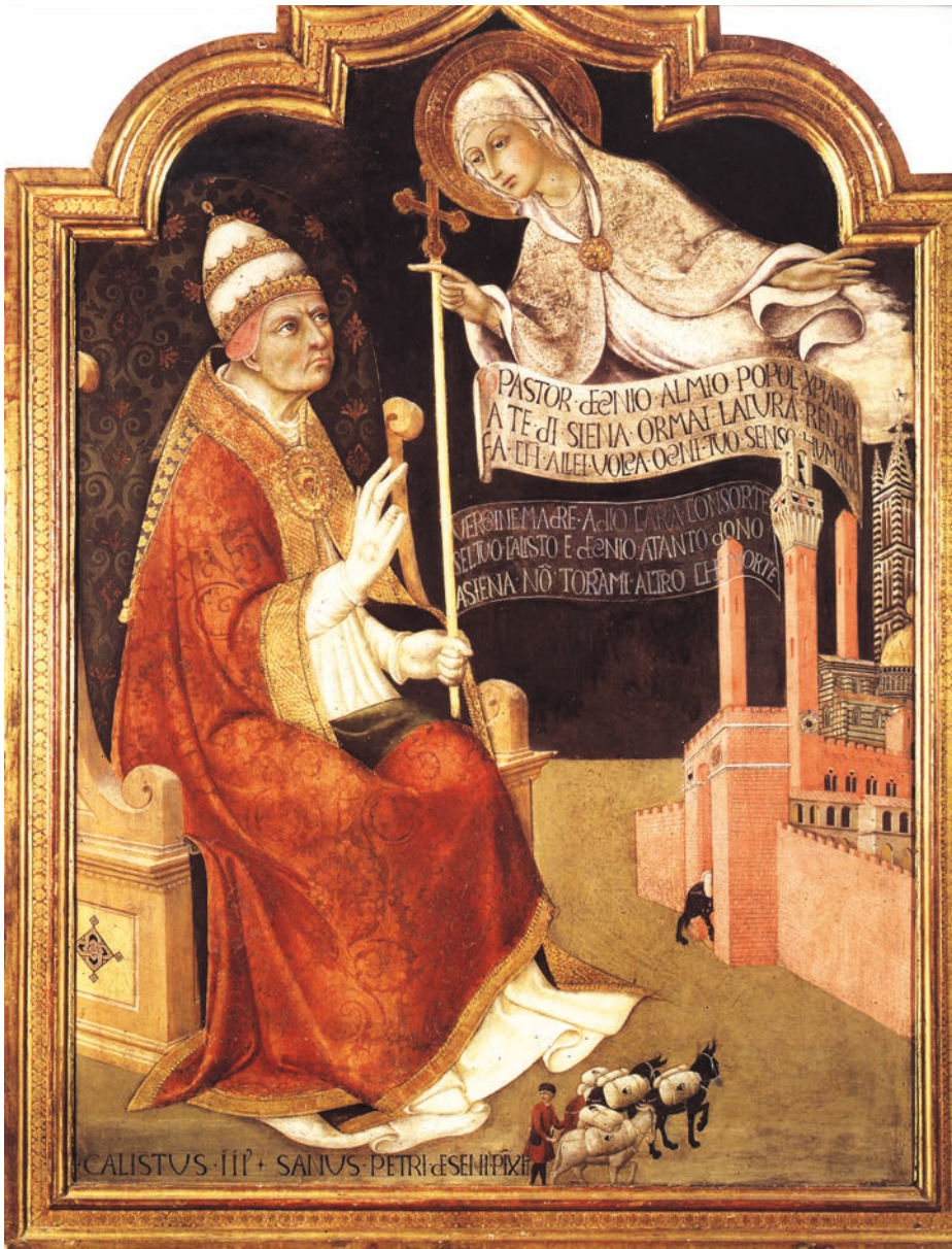
Calixto III, el primer papa Borgia. Alonso de Borja fue elegido papa en contra de los intereses de las dos familias principales, los Orsini y los Colonna. Este retrato le representa como protector de la ciudad de Siena y fue pintado por Sano di Pietro. Se encuentra en la Pinacoteca Nacional de Siena.