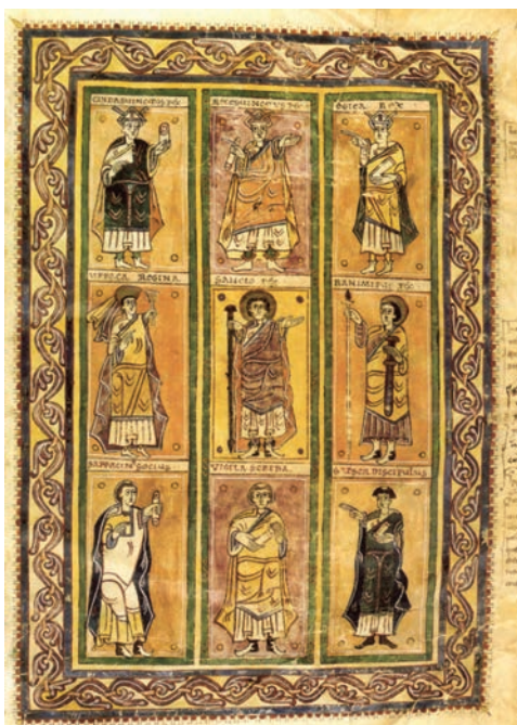
Ilustración del Códice Albedense o Codex Conciliorum Albedensis seu Vigilanus , fol. 428, ms. del 881 del monasterio riojano de San Martín de Albelda, en el que aparecen algunos reyes –como Chindasvinto, Recesvinto o Égica– y personajes de época visigoda, brillante en la organización territorial, la labor legislativa y el desarrollo cultural. Esta crónica recoge pasajes de la Hispania romana, de la monarquía visigoda y de los primeros reyes asturianos.

era la división en pars dominicata (reserva con trabajos de siervos) y pars indominicata (mansos con renta), una tendencia a apartelar la tierra que se aprecia en siglos posteriores en la Europa feudal. La institución del patrocinium , de época