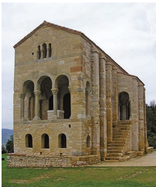
Palacio de Santa María del Naranco, Oviedo. El arte asturiano o ramirensé tuvo su apogeo en la segunda mitad del siglo IX, con ejemplos como el palacio de Santa María del Naranco y la iglesia de San Miguel de Lillo, en Oviedo, y la iglesia de Santa Cristina de Lena. Su estilo arquitectónico es precursor del románico.

Ramiro I (842-850) reprimió con dureza las rebeliones interiores, rechazó un desembarco vikingo en Gijón y defendió el reino de las incursiones musulmanas; además, desempeñó un mecenazgo artístico que embelleció el reino con palacios e iglesias. La Crónica Albeldense resume lacónicamente su reinado: