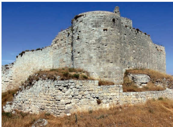
Castillo de Castrojeriz, en Burgos, poblado por Munio Núñez a finales del siglo IX. Castilla era un territorio fronterizo entre los vascos del norte y los musulmanes del valle del Ebro que desarrolló una función estratégica a través de una línea militar de fortalezas.

cuyo sustento era el botín de guerra y la concesión de tierras y salarios, amén de la pertinente exención fiscal y los privilegios jurídicos, que identifica al grupo noble durante las centurias medievales y modernas. Los cargos eclesiásticos también disfrutaban de privilegios económicos y jurídicos. En la base de la pirámide social, los campesinos y artesanos de las aldeas cargaban con las onerosas contribuciones impositivas.