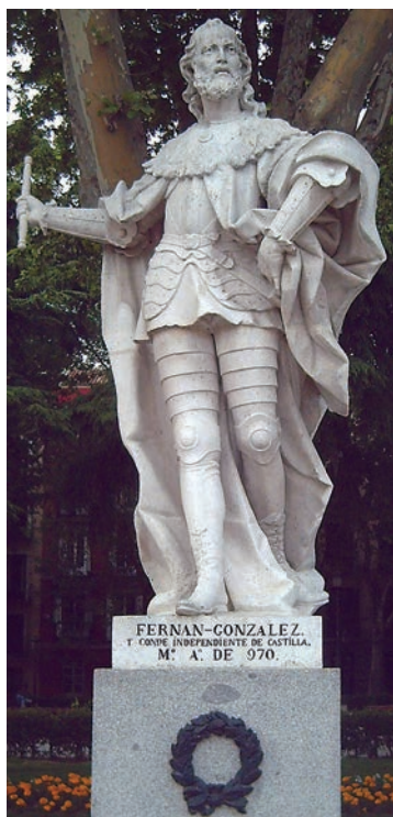
Estatua de Fernán González. Plaza de Oriente, Madrid. Fernán González es un personaje histórico cuya biografía, por la casi ausencia de fuentes altomedievales, ha sido cubierta por una aureola legendaria.

leonés olvidó pagar cumplidamente al conde y, al cabo de siete años, el montante de la deuda se había acrecentado hasta tal punto que el castellano le ofrecía la solución a su desconcierto: la independencia de Castilla a cambio de no sufragar tan astronómica cuantía de dinero. Nunca una deuda impagada costó tan cara a su deudor.