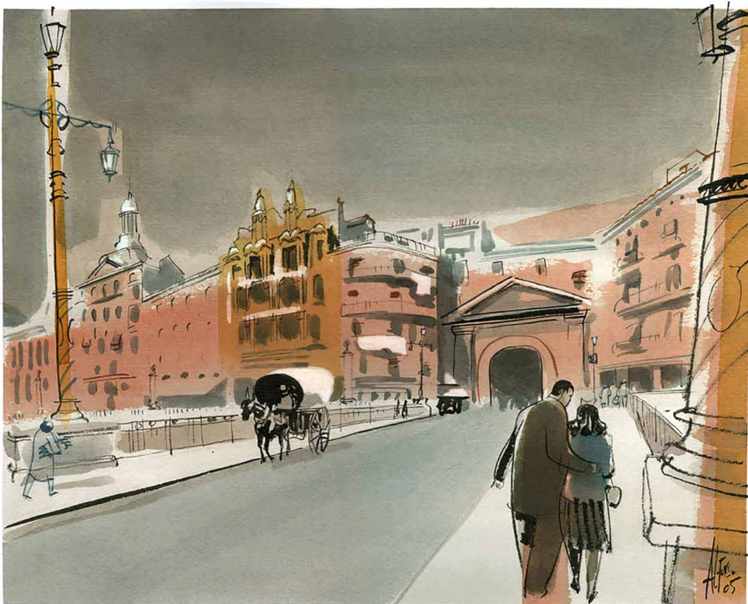
Tècnica mixta, 2005

Aquest pont de ferro, obra de l'enginyer Josep Boreas Romero, es va construir per substituir el de pedra que s'havia endut la riuada de 1907. Al seu torn, va ser volat durant la retirada de l'exèrcit republicà la tarda del 3 d'abril de 1938.