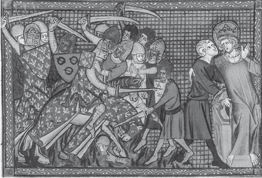
Figura 5: Malherido, el rey francés Luis IX es evacuado durante la batalla de El Mansura (1250), desastre que puso fin a la séptima cruzada en suelo egipcio. Miniatura del folio 199 de la Vida y milagros de san Luis , obra de Guillermo de Saint-Pathus, siglo XIV.

al campamento islámico resultaba imposible. Avanzar por el estrecho paso dominado por los enemigos parecía suicida y retroceder hubiera significado, a juicio de los dirigentes cristianos, una desbandada. Una situación tan comprometida se resolvió gracias a la ayuda inesperada de un individuo, buen conocedor de la zona, que avisó de la existencia de otro camino alternativo que permitía bajar de la sierra y acercarse al campamento califal sin excesivos riesgos. El consejo se mostró útil y decisivo para el posterior desarrollo de la campaña, así que no debe extrañar que algunos testigos –aunque no todos– dejaran constancia de aquellos hechos. En efecto, interpretaron la aparición de aquel personaje en términos providencialistas y entendieron que a través de él Dios auxiliaba a los suyos, pero en sí misma aquella persona no parece que tuviera un carácter sobrenatural: para el propio rey de Castilla no era más que un «rústico»; para el arzobispo Jiménez de Rada, que también estaba presente, no era sino «un hombre del lugar, muy desaliñado en su ropa y persona, que tiempo atrás había guardado ganado en aquellas montañas y se había dedicado allí mismo a la caza de conejos y liebres», un ser humano a quien Dios –«que se sirve de las escorias del mundo»– utilizaba como enviado. 69 No obstante, poco después otros cronistas –contemporáneos, pero no testigos de aquellos hechos– comienzan a