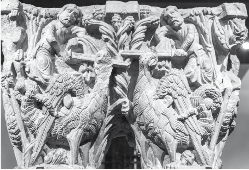
Figura 3: Capitel románico geminado del monasterio de Santa María la Real de Aguilar de Campoo (Palencia), datado en la segunda mitad del siglo XII, que representa a dos guerreros armados con espadas abatiendo a dos grifos. Fundado a mediados del siglo X, el monasterio recibió un impulso decisivo gracias al amparo personal del rey Alfonso VIII ( reg. 1158-1214), vencedor de las Navas de Tolosa. Museo Arqueológico Nacional de Madrid.