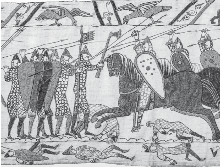
Figura 1: Detalle de la escena LII del tapiz de Bayeux (s. XI), que muestra la embestida de la caballería normanda del futuro Guillermo I contra el muro de escudos de los huscarles del rey anglosajón Haroldo II Godwinson, durante la famosa batalla de Hastings (1066), cuyo desenlace supuso el final de la Inglaterra sajona. Musée de la Tapisserie de Bayeux, Normandie (Francia).

señala de forma expresa que, dado que esta fue una guerra de cercos y no de batallas, no se detendría en ella y, en consecuencia, le dedicó poco más de dos páginas que contrastan llamativamente con las casi treinta en las que expone el desarrollo de las principales batallas campales sostenidas por los castellanos y leoneses contra almorávides y almohades (Zalaca, Uclés, Alarcos y, sobre todo, las Navas de Tolosa). 12 Para la Baja Edad Media, encontramos situaciones similares: no deja de ser significativo, por ejemplo, que toda una fase de la Guerra de los Cien Años, la que transcurre entre 1368 y 1415, en la que los franceses recuperan buena parte del territorio perdido en décadas anteriores, se tenga como una época en la que hubo «luchas poco exitosas» que no respondían a plan alguno, simplemente porque la estrategia de los franceses fue la de evitar la batalla directa. 13