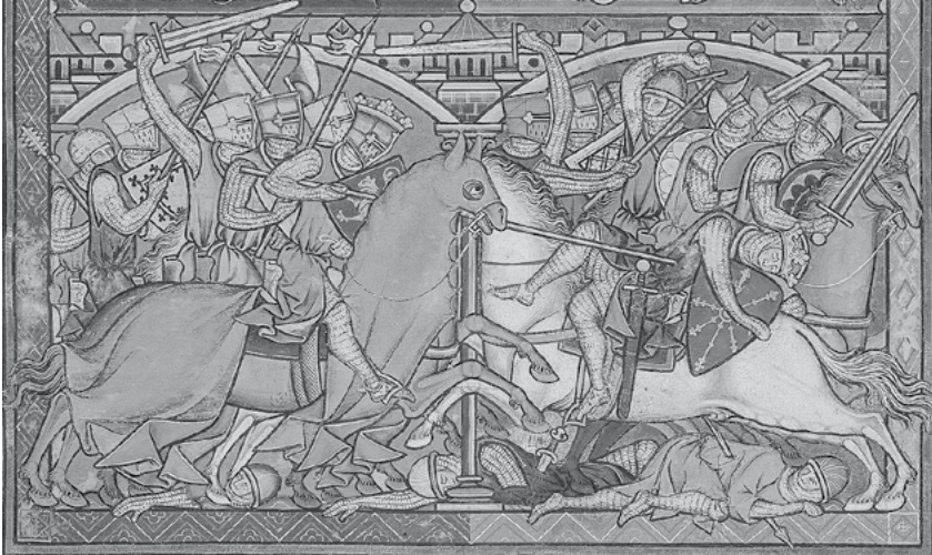
Figura 6: Dos formidables contingentes de caballería, equipados según los estándares de la primera mitad del siglo XIII chocan en esta elaborada miniatura del folio 41 recto de la llamada Biblia Maciejowski, en la actualidad preservada en la Morgan Library & Museum de Nueva York.

la inasistencia únicamente podía explicarse si era consecuencia de enfermedad u otra causa mayor. No existían excepciones: todos los naturales del reino que fuesen llamados tenían que hacer acto de presencia en la hueste real, incluso si eran vasallos de otros reyes o señores que estuvieran enemistados con el rey natural o si ellos mismos estuviesen desnaturalizados. 90 Bien puede considerarse que estas consideraciones eran la plasmación normativa del miedo o de la cautela ante el choque campal.