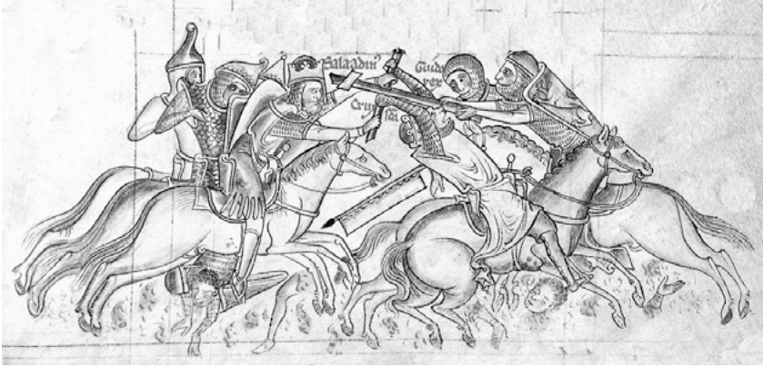
Figura 2: Saladino abate de un mandoble al rey Guido I de Jerusalén en la batalla de Hattin (1187). Aunque históricamente no terminó con la muerte de Guido de Lusignan, la derrota de Hattin supuso un punto de inflexión para la presencia cruzada en Oriente. Miniatura de Mateo de París en su Chronica Majora , siglo XIII. British Library, Londres.

murallas— y la escasa significación de muchos encuentros, revela de una manera muy clara tanto el pensamiento de los historiadores militares en torno al papel e importancia de la batalla en los conflictos como su perplejidad ante los usos militares del periodo: «¿Se desconocía en la Edad Media la teoría de que, en una guerra, la batalla es la verdadera acción decisiva, y que la primera ley de la estrategia es, por ello, reunir todas las fuerzas propias en el campo de batalla?». 29 Como ya hemos podido comprobar en páginas anteriores, el resultado de este tipo de apreciaciones fue una sustancial distorsión de la imagen de los medios y las acciones militares de unas sociedades que, atendiendo a sus realidades políticas, institucionales, tecnológicas, económicas y financieras, diferían de un modo notable de los aplicados por los estados europeos de los siglos XVIII, XIX y primera mitad del siglo XX.