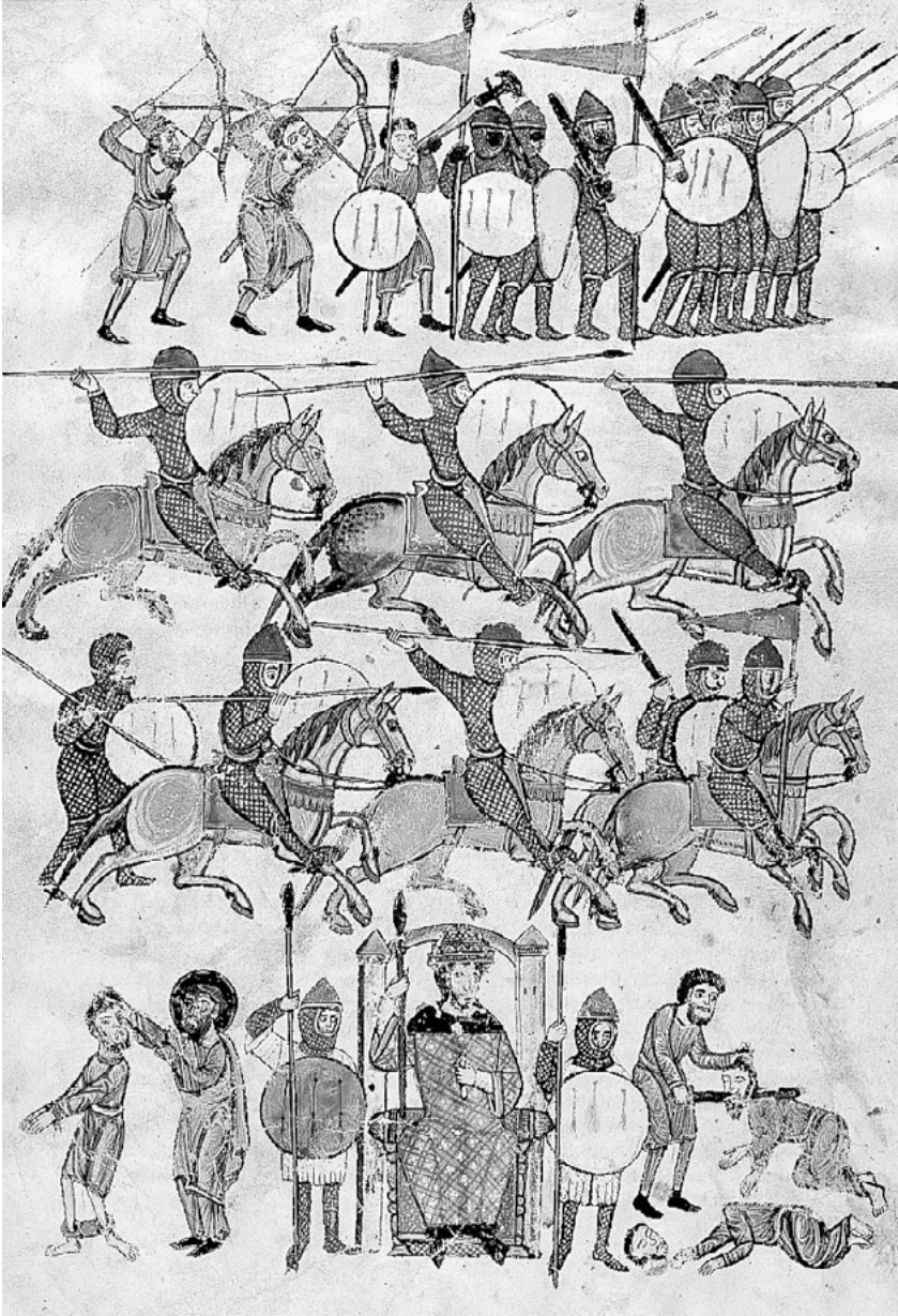
Figura 4: Miniaturas del folio 149 del Beato de las Huelgas, compuesto hacia 1220, que muestra a las fuerzas del rey babilonio Nabucodonosor II durante el cerco de Jerusalén. Los babilonios se equipan, sin embargo, según los estándares de inicios del XIII, llamando poderosamente la atención el perfecto muro de escudos respaldado por arqueros de la parte superior y las adargas que portan la mayoría de los soldados. Morgan Library & Museum de Nueva York.