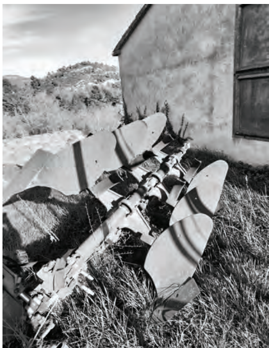
Arades, la Molsosa. El Solsonès.