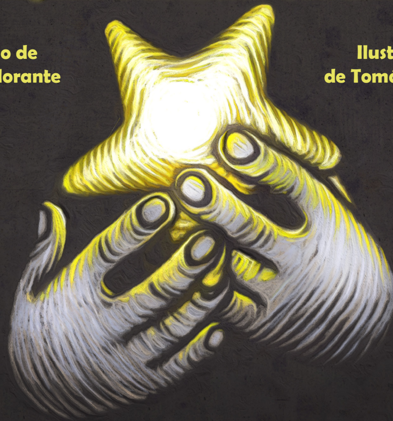
Ilustración de Tomás Hijo