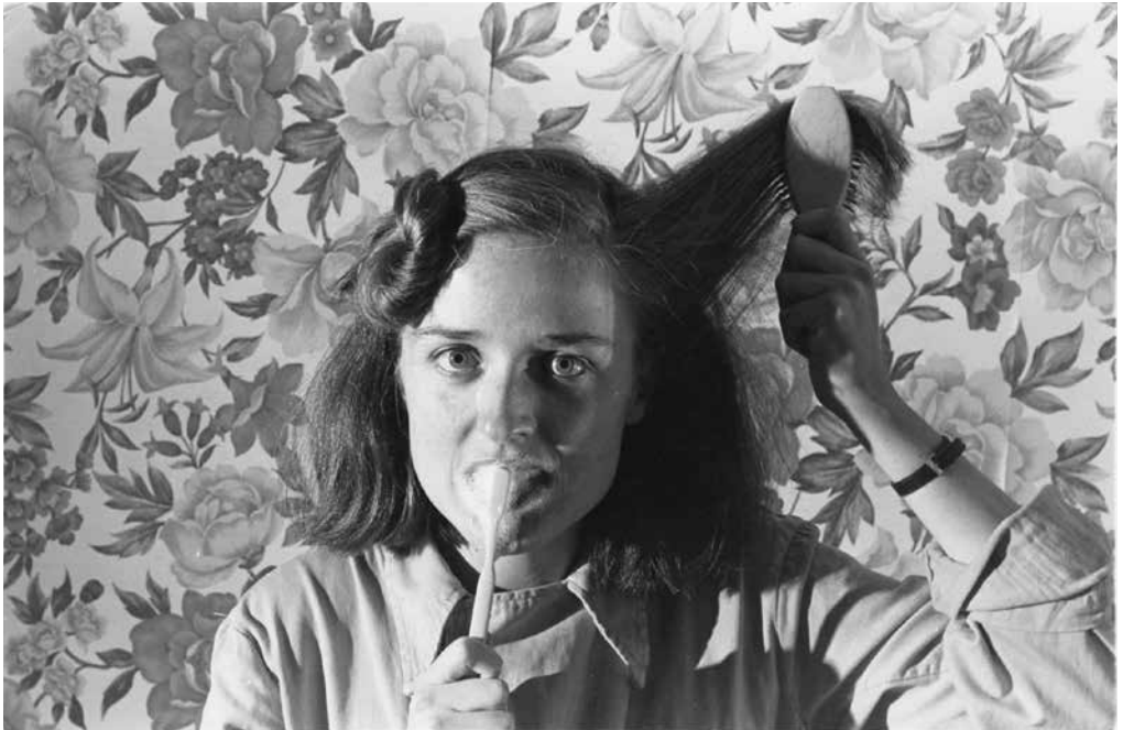
Su amiga Fotógrafa , de la sesión «Un día cualquiera, me lavo los dientes, me cepillo el pelo y me hago una foto delante de un rollo de papel», s. a. [¿1979-1980?]. Fotografía b/n, 17.7 x 23.3 cm