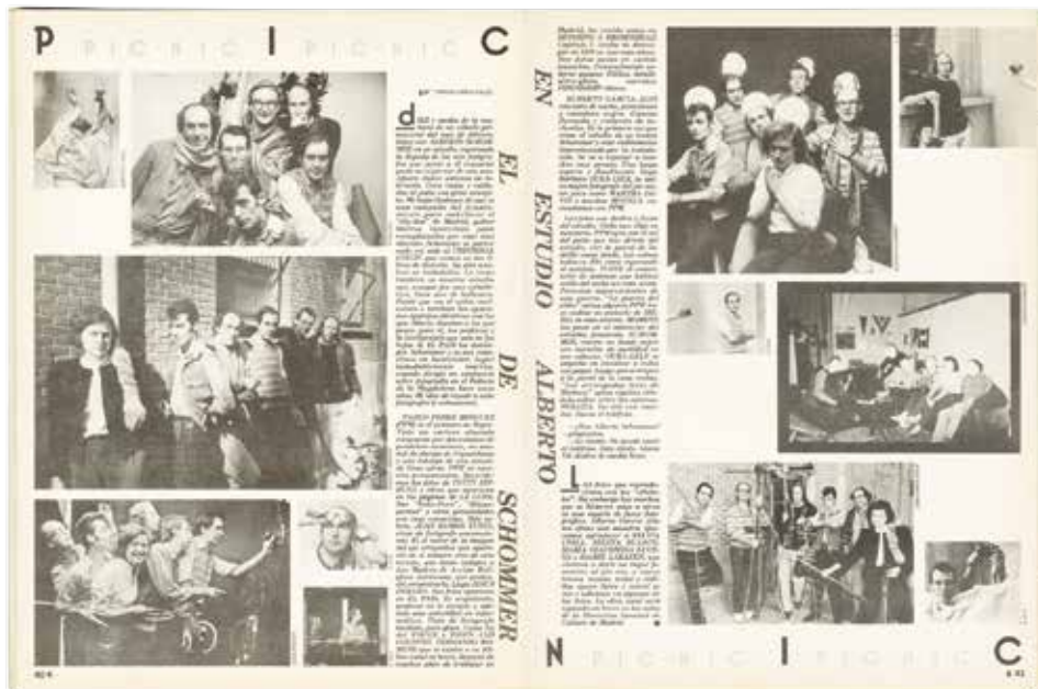
Foto Pic-Nic, s. a. [¿1984?]. Impreso Interior de La Luna de Madrid , n.º 5, Madrid: Permanyare Producciones, marzo de 1984