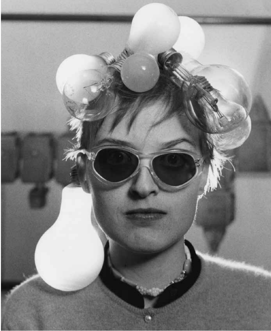
Ouka Leele, s. a. [?]1982?