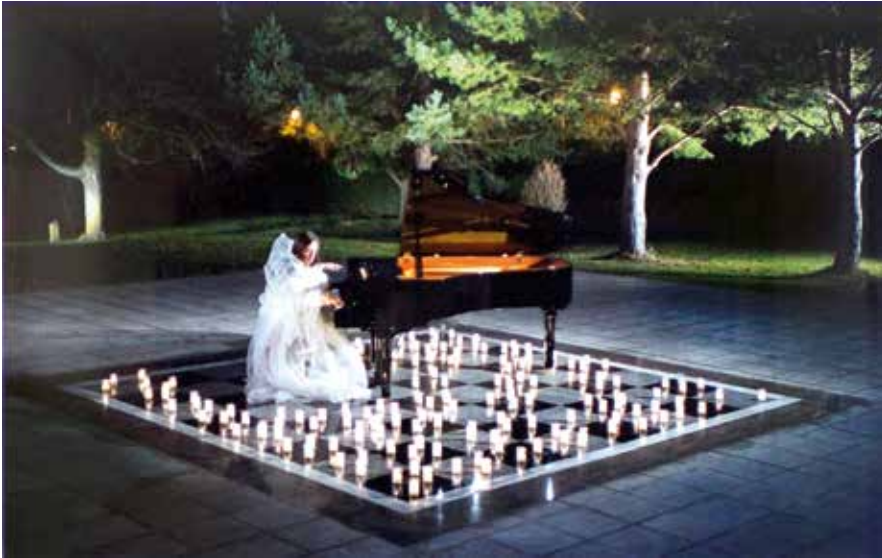
Pablo Hojas: Ouka Lele, Polientes , 2012. Colección Fundación Caja Cantabria

cámaras, destaca la fotógrafa americana Elsa Dorfman (1937-2020), famosa por sus retratos de gran tamaño realizados con la Polaroid gigante que había en la Escuela del Museo de Bellas Artes de Boston. Dorfman es conocida por inmortalizar en estas instantáneas, a partir de 1980, a algunos de los protagonistas de la generación beat, especialmente a Allen Ginsberg (1926-1997). 31