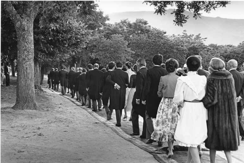
¿A dónde irán? , 1977/2021. Fotografía b/n, 30.3 x 40.5 cm