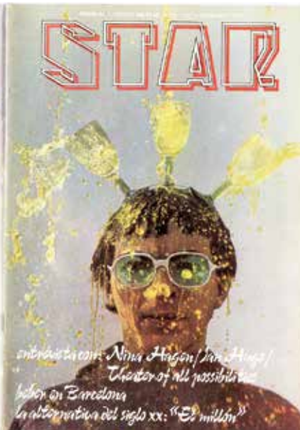
Bocetos para Star , s. a. Lápices de colores sobre papel, 27,5 x 21.5 cm Cubiertas de Star , número 2, Barcelona: Producciones Editoriales, noviembre de 1979