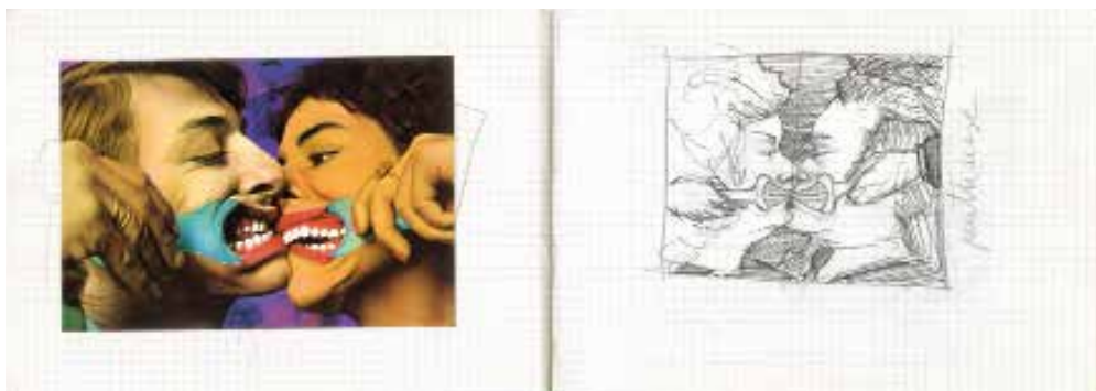
Interior del cuaderno Ideas, cosiitas y de todo , 1980. Técnica mixta sobre papel, 21 x 15 cm