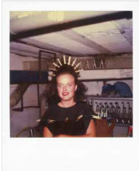
Ouka Leele en el Gran Concierto de Pop Rock, en el que actuó con Poch y el Hortelano, Santander, 1987. Polaroid, 10.8 x 8.8 cm. Fotografía atribuida al Hortelano

tesis doctoral. Ocharan, natural de Bilbao, residió durante mucho tiempo en Castro Urdiales donde construyó su magnífica y onírica residencia Toki Eder [lugar hermoso]. 28 Sus obras más conocidas fueron las ilustraciones fotográficas de La Divina Comedia (1904) y El Quijote (1905). Para estas utilizó una realidad que había transformado en tableaux vivant , y en muchos casos positivaba sus negativos con la técnica pictorialista del carbón, que otorgaba a cada fotografía el valor de objeto único.