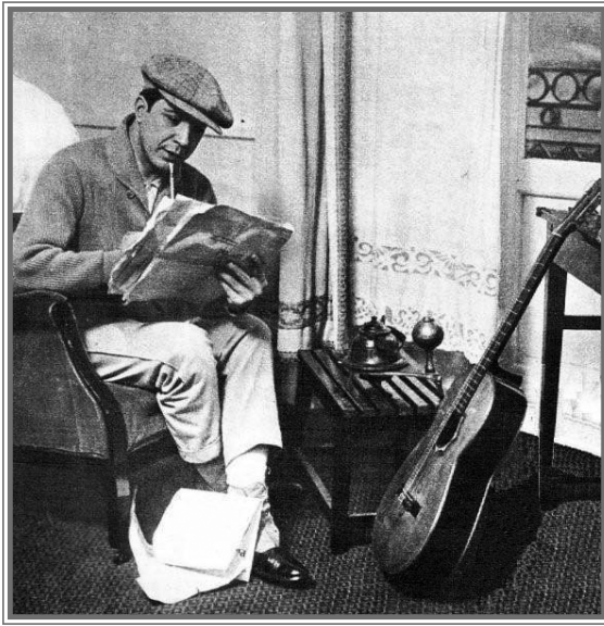
Carlos Gardel en un hotel de España.

No cabe duda de que supo aprovechar la oportunidad que le brindaron los encuentros y las fiestas de Isabel Llorach, que le dieron el empujón hacia el reconomiento social y musical que tanto anhelaba el cantor. Además, sus discos se vendieron muy bien, aunque ello no influyó para conseguir más actuaciones en Barcelona. Por supuesto, a ello ayudó la fiebre por el tango que se encontró allí.