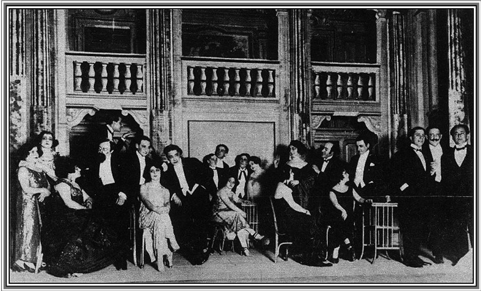
La Compañía Rivero-De Rosas en el Teatro Apolo de Madrid en enero de 1924. Gardel y Razzano aparecen en el extremo derecho de la fotografía.

Al día siguiente, 6 de diciembre, llegaron a Madrid en tren, al que se subieron doce horas después de desembarcar 8 . En la capital española, se reencontraron con el ya Premio Nobel de Literatura Jacinto Benavente, al que habían conocido un año antes en Buenos Aires, y, como frecuentaban los cafés y la vida nocturna madrileña, saludaron al escritor Ramón del Valle-Inclán, al torero Ignacio Sánchez Mejías y a los actores María Guerrero y Fernando Díaz de Mendoza, entre otros 9 .