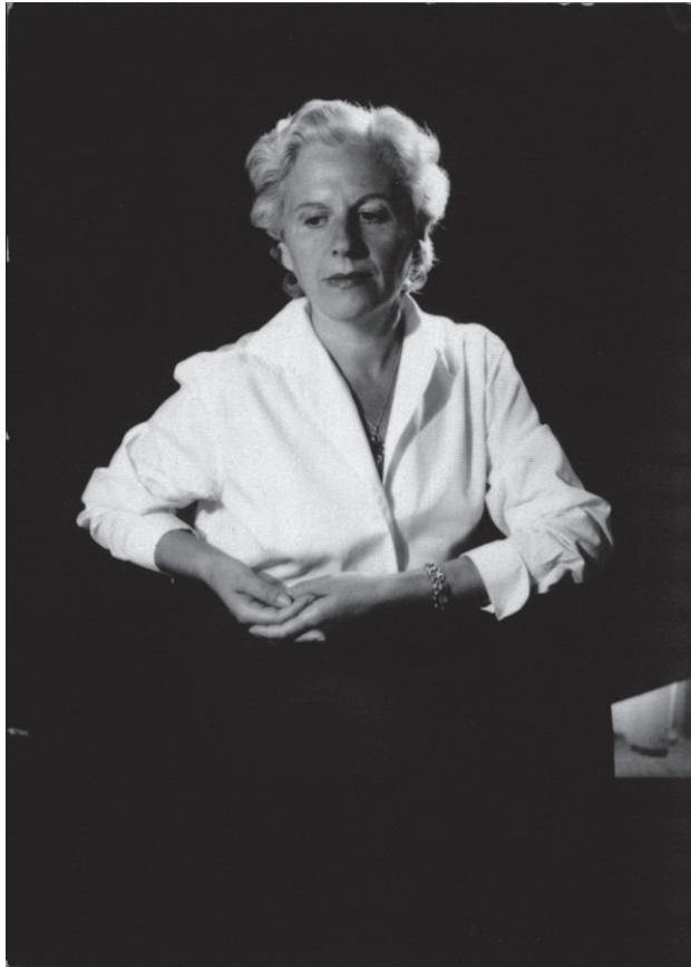
Foto d'estudi de Mercè Rodoreda, feta probablement a Ginebra a finals de 1950.