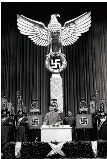
Parteiadler que mira hacia la izquierda.

En la cinematografía propagandística inspirada por Goebbels (v.), el águila dominadora de los cielos simboliza el dominio de la tierra por el ejército alemán en sus victoriosos avances, y muy especialmente de la Luftwaffe (v.), cuyos jóvenes pilotos eran «las águilas del Reich». 11