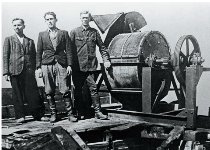
Trituradora de huesos del campo de exterminio de Janowska, 1942.

En 1943 los alemanes desmantelaron los campos de exterminio (v.) de Treblinka, Belzec y Sobibor, allanaron los solares y plantaron árboles. Auschwitz (v.), con sus tres enormes recintos, era demasiado extenso para tales disimulos, pero por lo menos volaron las cámaras de gas y los crematorios, e incendiaron los depósitos de ropa cuando ya el cañoneo ruso se escuchaba como una tormenta distante en el horizonte.