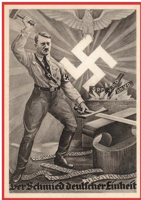
Hitler forja la espada de Germania, 1930.