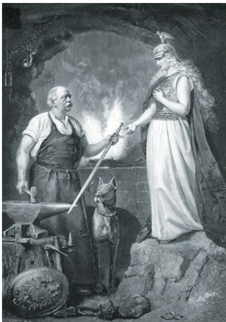
Bismarck forja la espada de Germania, 1880.

Nótese que el nazismo conjugaba su amor al progreso técnico, propio de la superior ciencia alemana, con los prejuicios de una ideología reaccionaria. De un lado, autopistas, Volkswagen (v.), 30 investigación, mecanización, estado del bienestar impulsado por instituciones como Kraft durch Freude (v.) o KdF, y las colonias