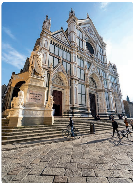
Basilica di Santa Croce, Florencia (p. 429).