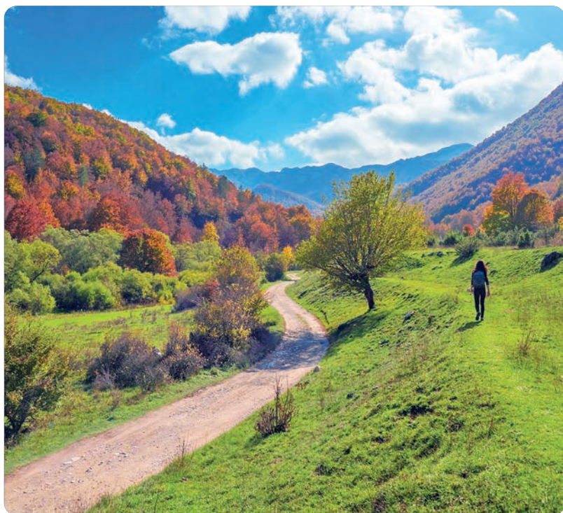
Parco Nazionale d'Abruzzo, Lazio e Molise (p. 153).